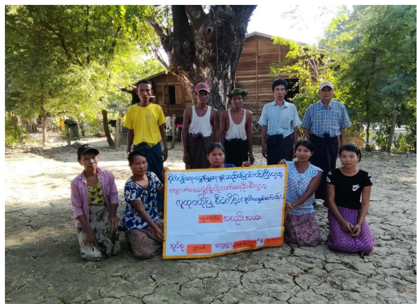
ကျေးရွာစီမံကိန်းအထောက်အကူပြု ကော်မတီဝင်များ