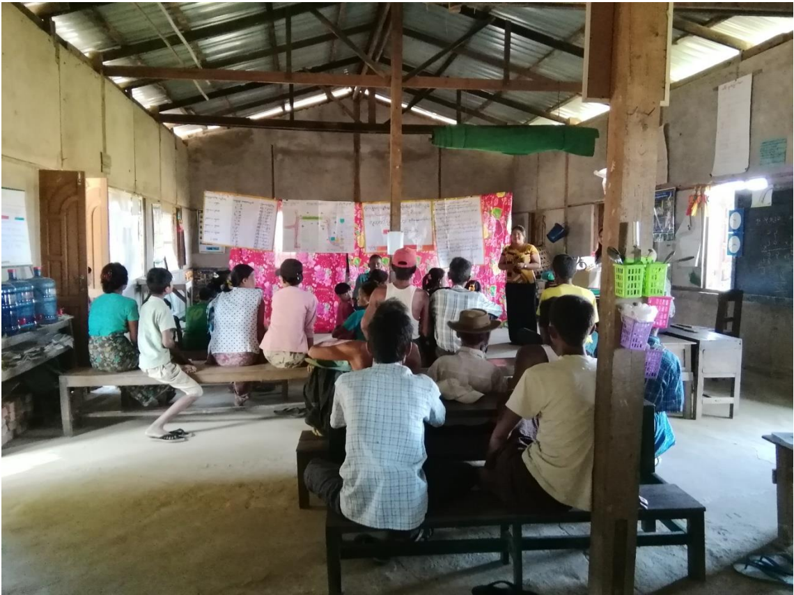
ပ+ဒု ကြိမ်ကျေးရွာအစည်းအဝေးကျင်းပနေပုံ