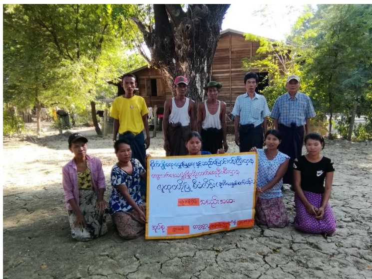
ကျေးရွာစီမံကိန်းအထောက်အကူပြု ကော်မတီဝင်များ