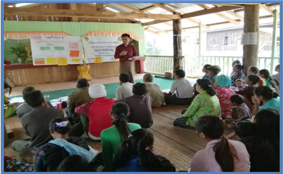
၇။ ကော်မတီဝင်များရွေးချယ်ခြင်းနှင့် ကျေးရွာဖွံ့ဖြိုးရေးအစီအစဉ်ဆောင်ရွက်မှု မှတ်တမ်းခါတ်ပုံများ