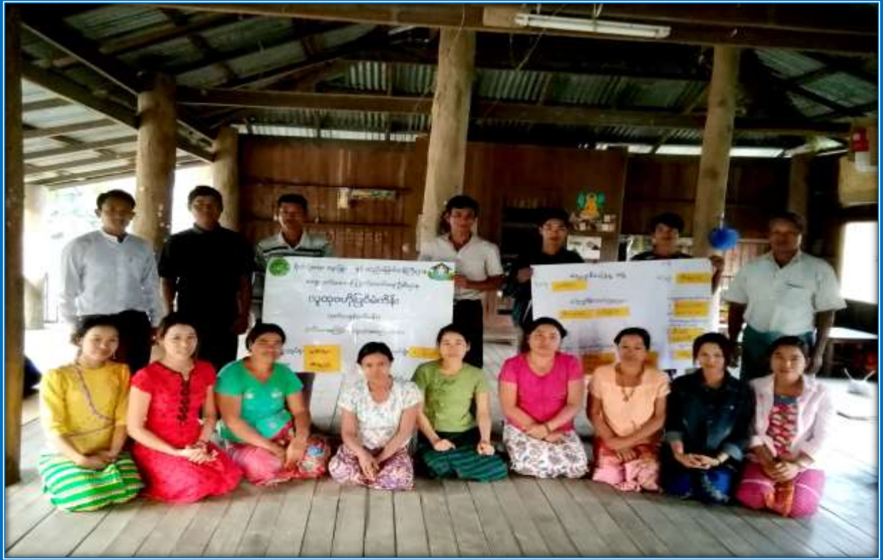
၇။ ကော်မတီဝင်များရွေးချယ်ခြင်းနှင့် ကျေးရွာဖွံ့ဖြိုးရေးအစီအစဉ်ဆောင်ရွက်မှု မှတ်တမ်းဓါတ်ပုံများ