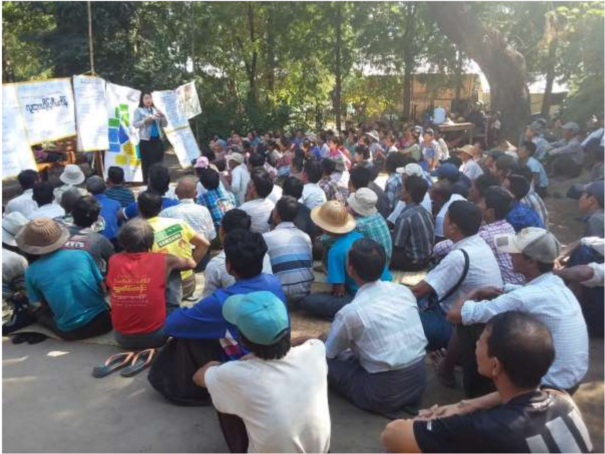
အစည်းအဝေးတွင် PRA များရေးဆွဲနေပုံ