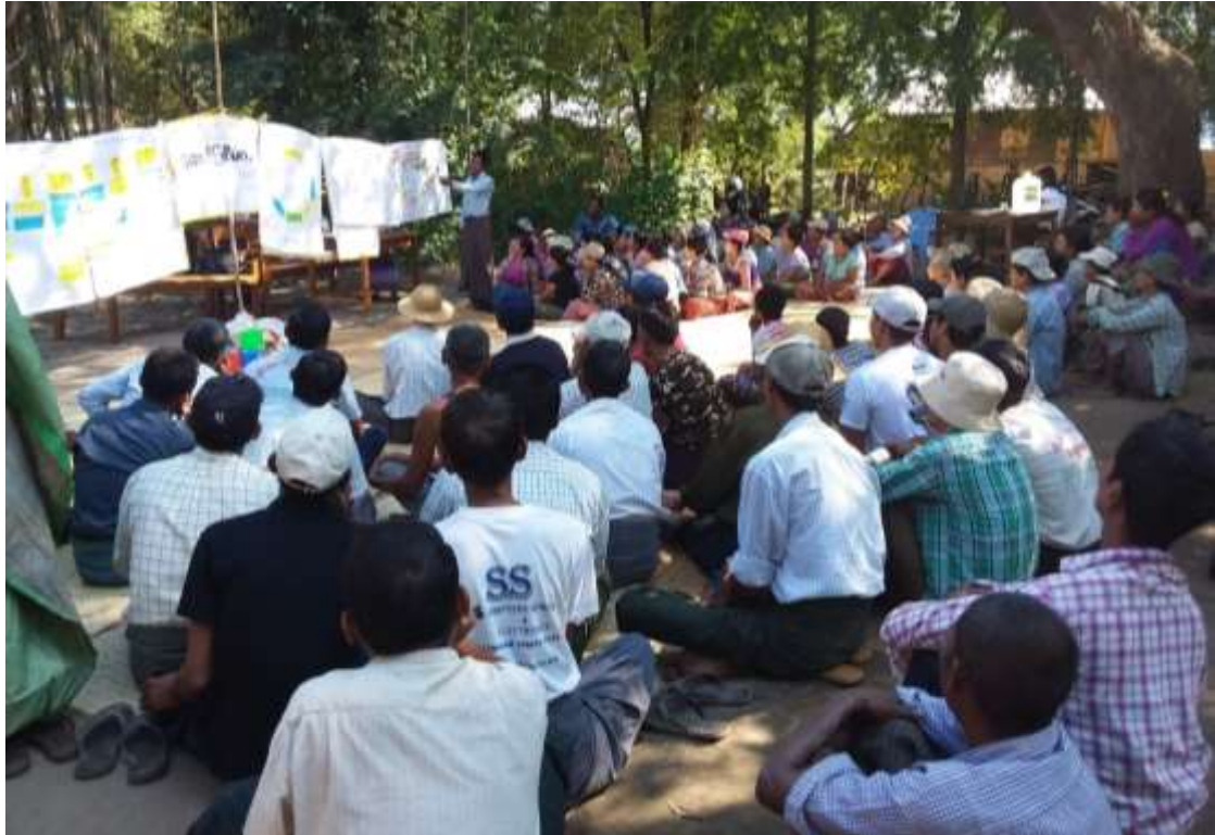
အစည်းအဝေးကျင်းပဆောင်ရွက်နေပုံ