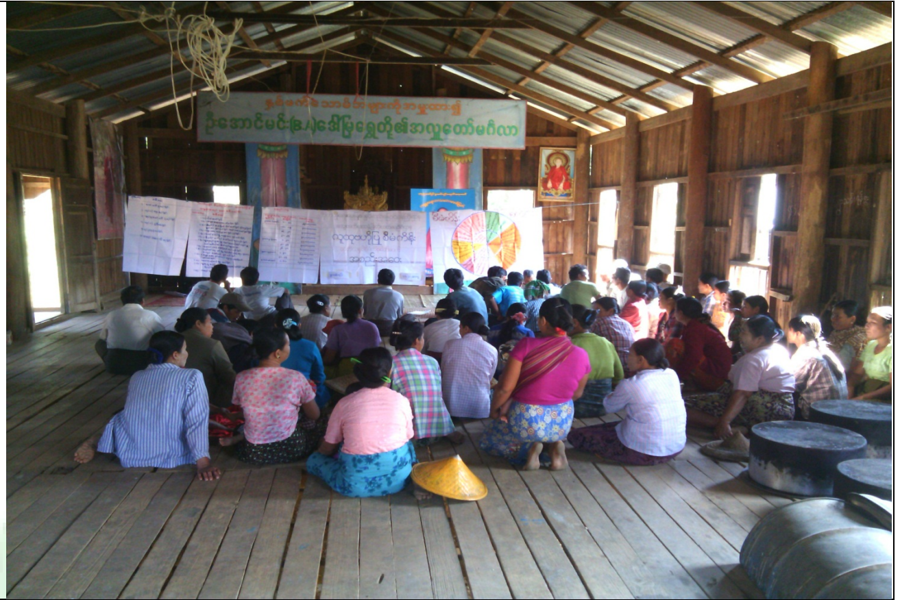
စေတနာ့ဝန်ထမ်းများရွေးချယ်ခြင်းမှတ်တမ်းခါတ်ပုံ