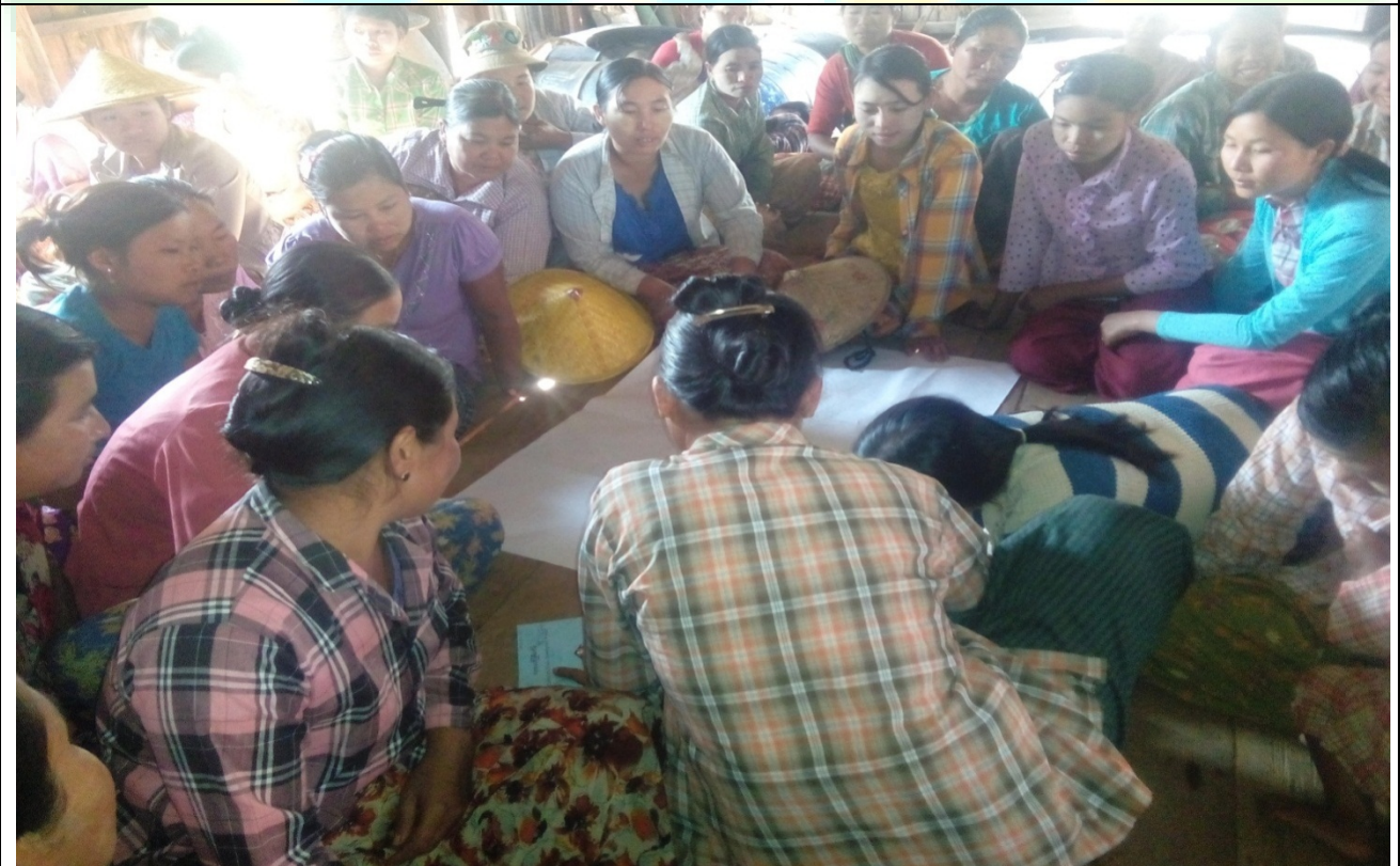
ထိခိုက်လွယ်အုပ်စုများ၏မှတ်တမ်းဓါတ်ပုံ