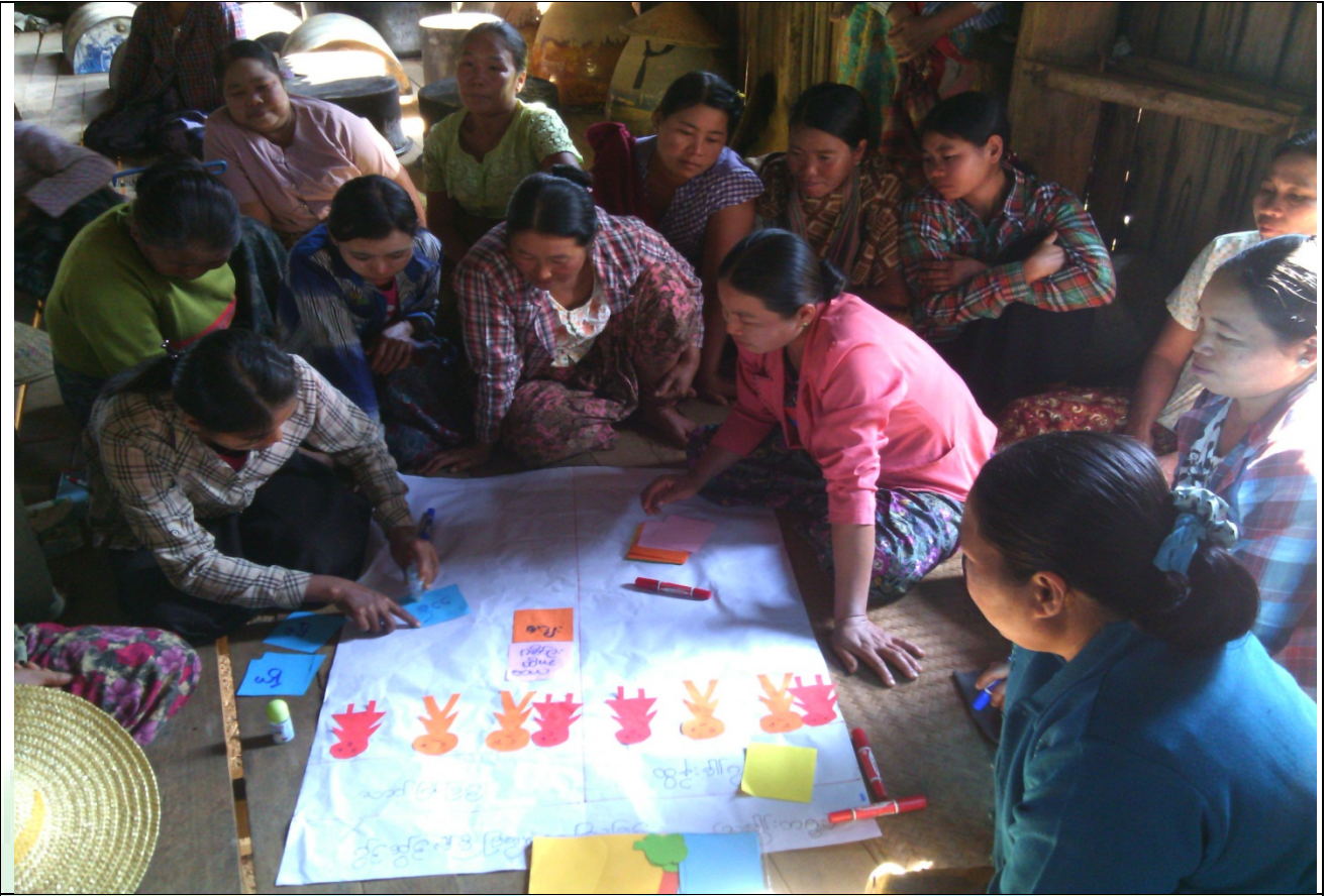
ဖွံ့ဖြိုးရေးအစီအစဉ်ရေးဆွဲခြင်းမှတ်တမ်းဓာတ်ပုံ