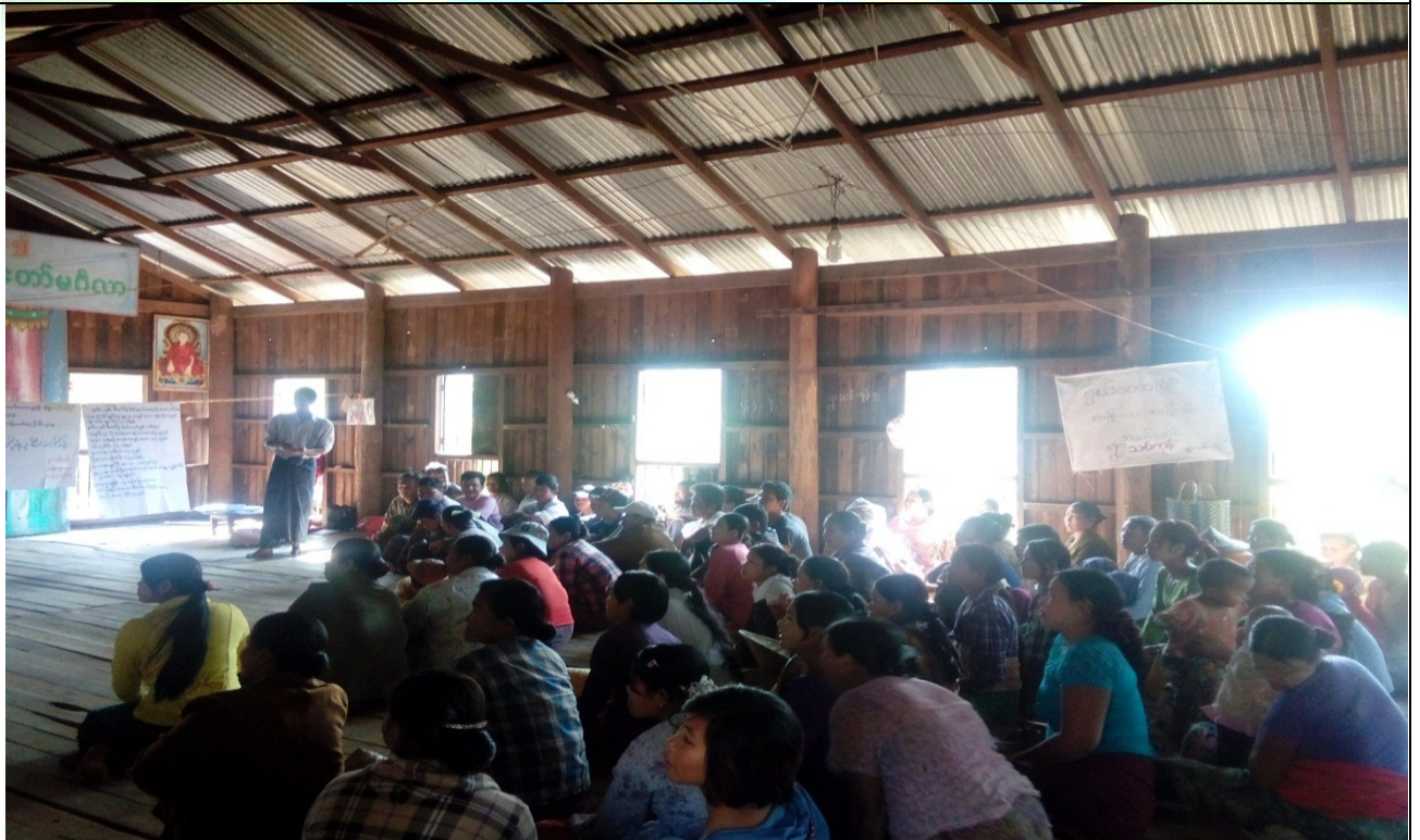
ကော်မတီရွေးချယ်ခြင်းမှတ်တမ်းခါတ်ပုံ