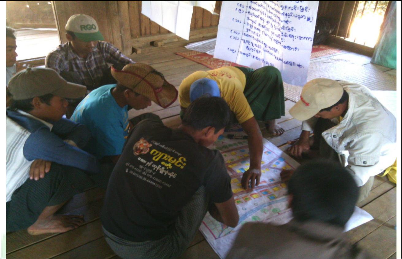
ဖွံ့ဖြိုးရေးအစီအစဉ်ရေးဆွဲခြင်းမှတ်တမ်းဓါတ်ပုံ