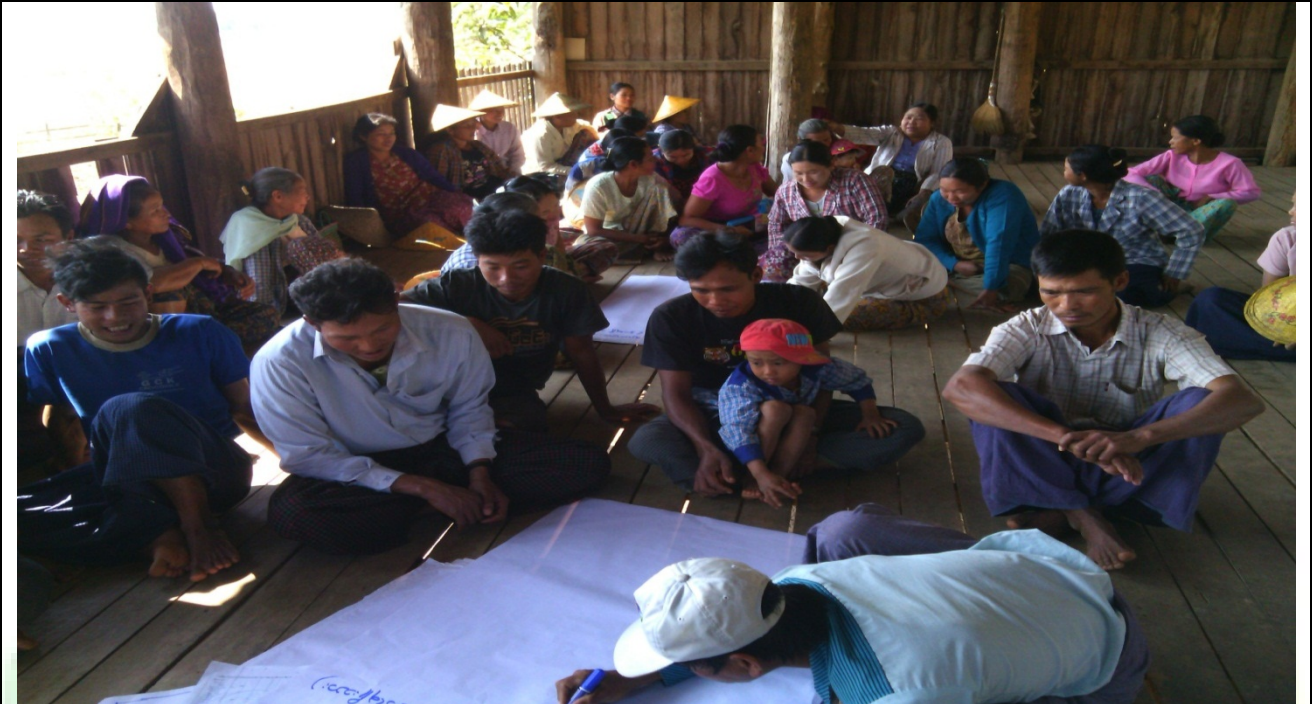
အမျိုးသားအုပ်စု၏မှတ်တမ်းခါတ်ပုံ