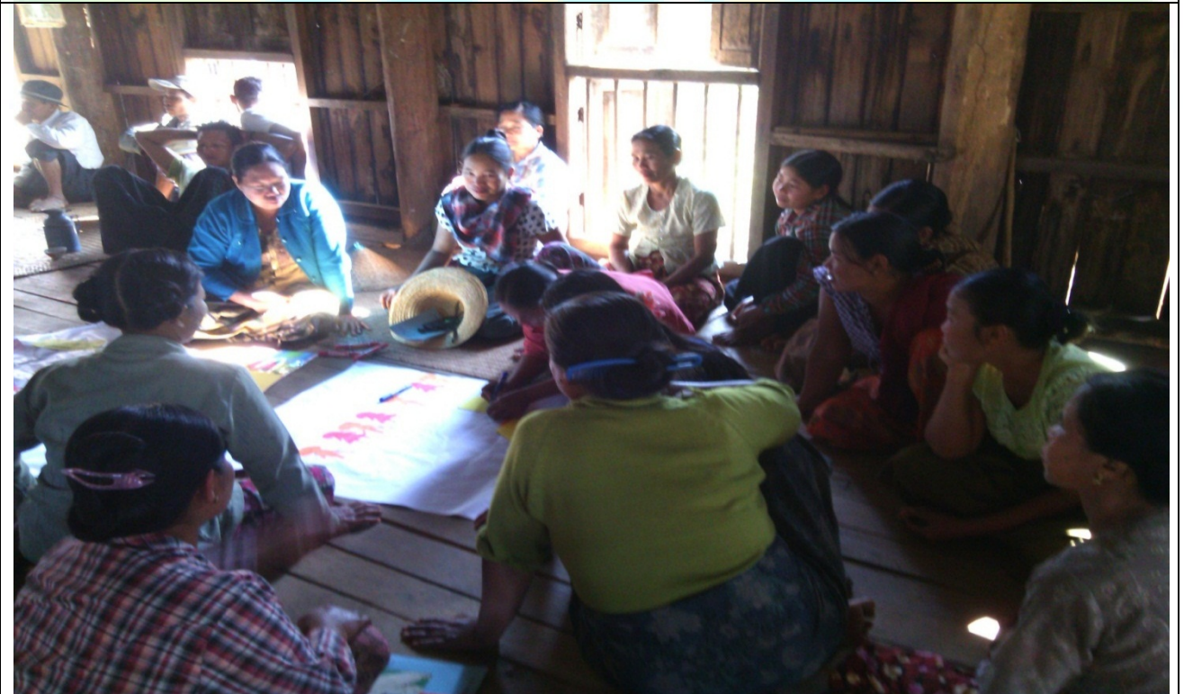
ဖွံ့ဖြိုးရေးအစီအစဉ်ရေးဆွဲခြင်းမှတ်တမ်းဓာတ်ပုံ