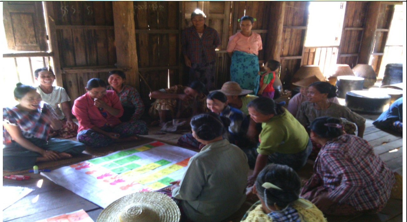
အမျိုးသမီးအုပ်စု၏မှတ်တမ်းခါတ်ပုံ