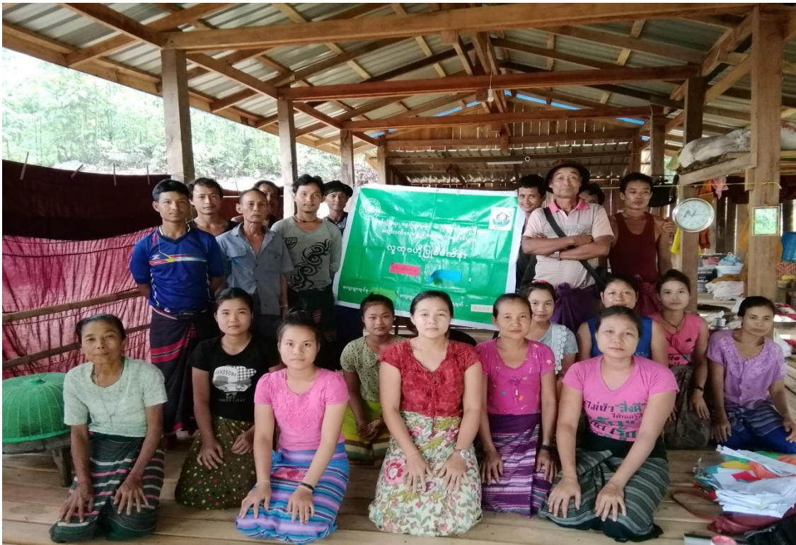
စက္ကဝက်ကျေးရွာအုပ်စု၊ ရွာသစ်ကျေးရွာ ၂၀၁၉-ခုနှစ်

လူထုဗဟိုပြုစီမံကိန်း ကျေးလက်မြို့နယ်၊ ကရင်ပြည်နယ် ကျေးရွာဖွံ့ဖြိုးရေးအစီအစဉ်