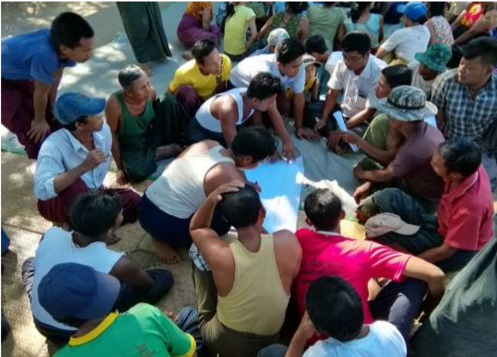
ကျေးရွာရှိ အခက်အခဲများမျှော်မှန်းခက်များဖော်ထုတ်နေစဉ်