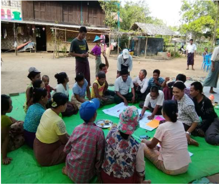
မှတ်တမ်းခိတ်ပုံများ စီမံကိန်းမိတ်ဆက်အားရှင်းလင်းပြောကြားစဉ်