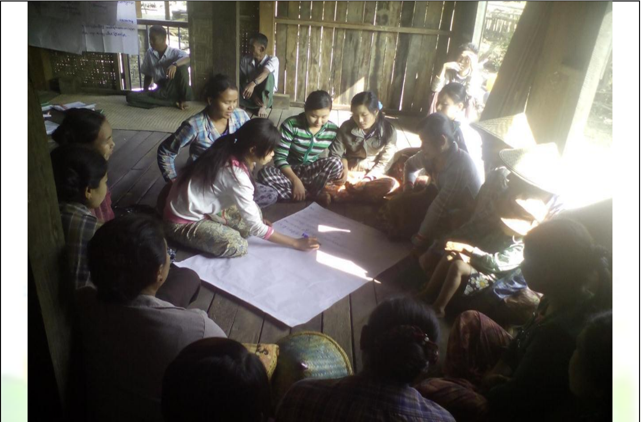
လူငယ်အုပ်စု၏ မှတ်တမ်းခါတ်ပုံ