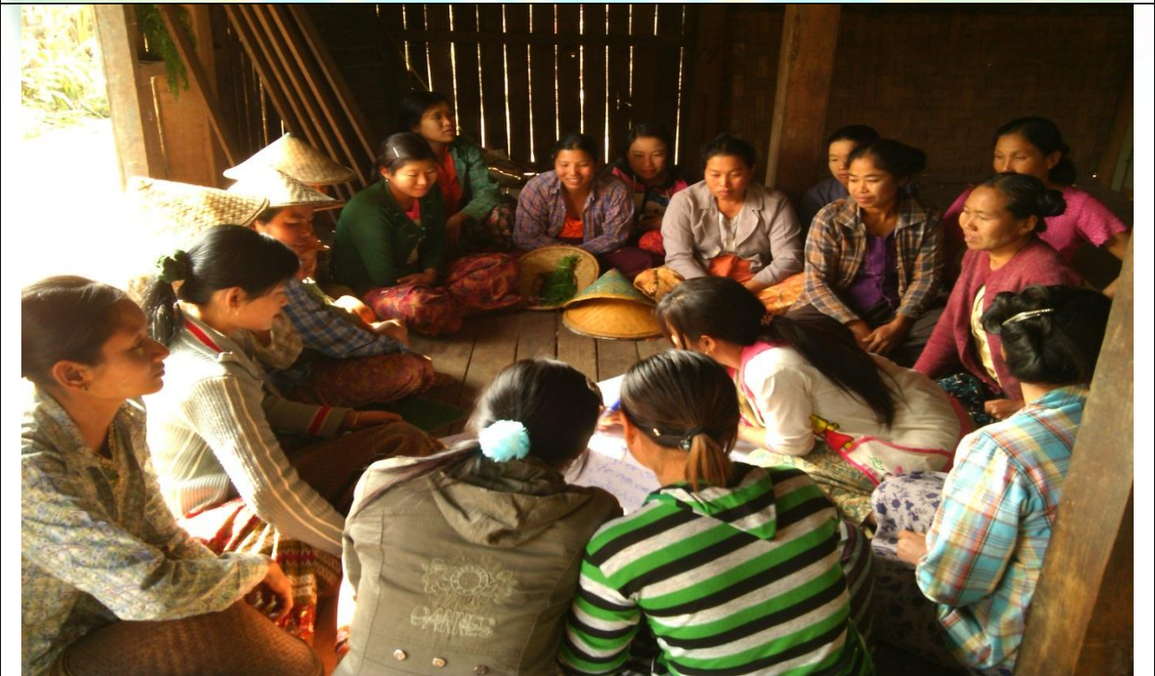
အမျိုးသမီးအုပ်စု၏ မှတ်တမ်းခါတ်ပုံ