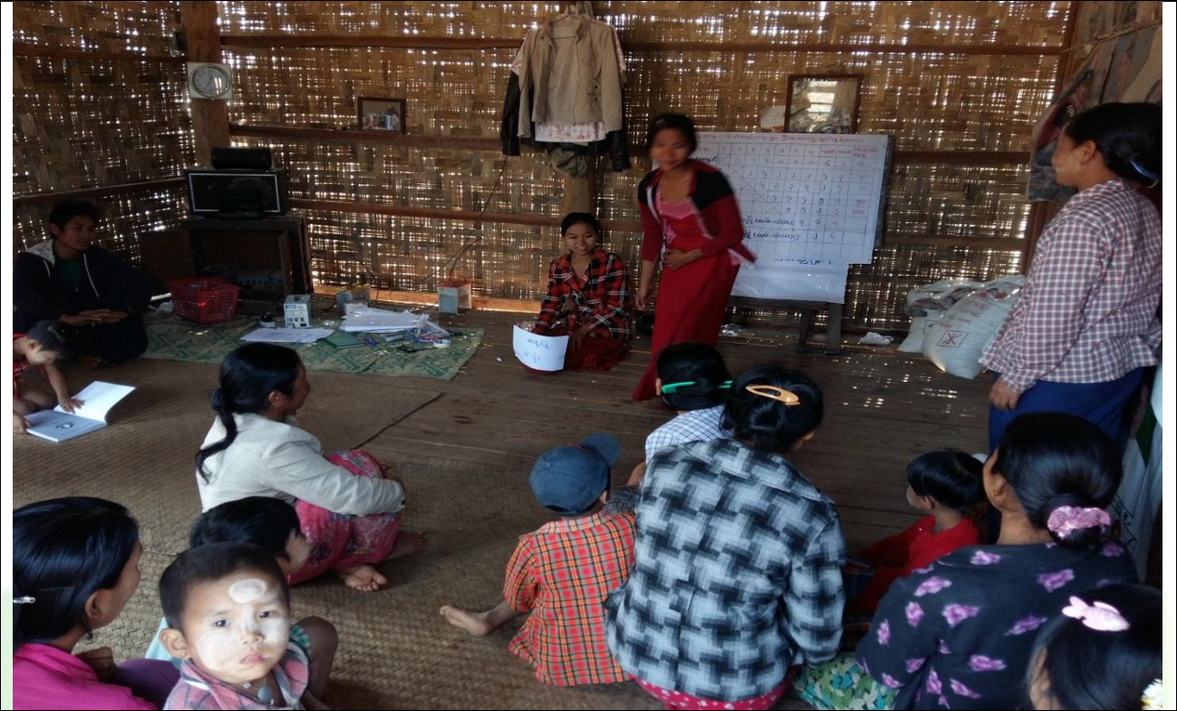
အမျိုးသားအုပ်စု၏ မှတ်တမ်းခါတ်ပုံ