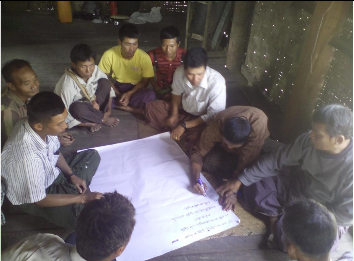
စေတနာ့ဝန်ထမ်းများ ရွေးချယ်ခြင်း မှတ်တမ်းခါတ်ပုံ