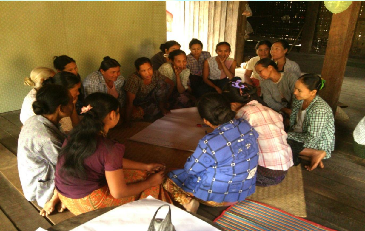
ကော်မတီရွေးချယ်ခြင်း မှတ်တမ်းခါတ်ပုံ