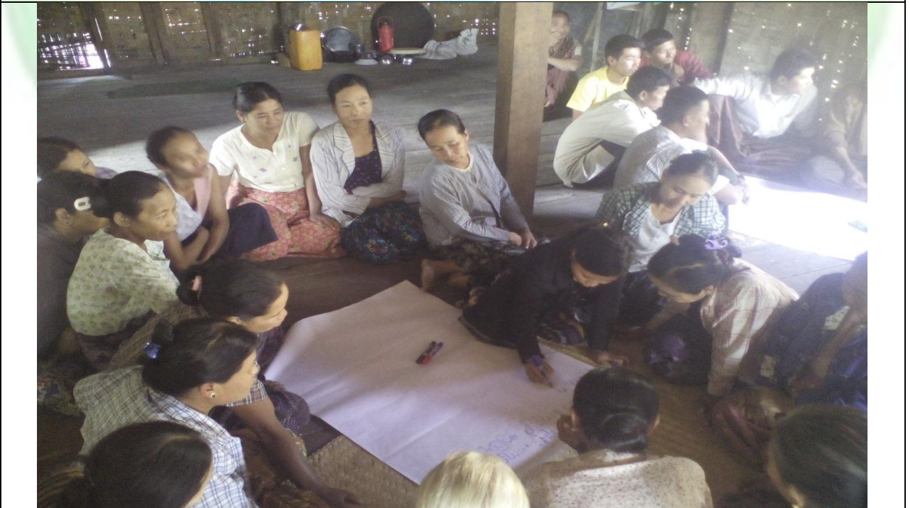
ထိခိုက်လွယ်အုပ်စုများ၏ မှတ်တမ်းခါတ်ပုံ