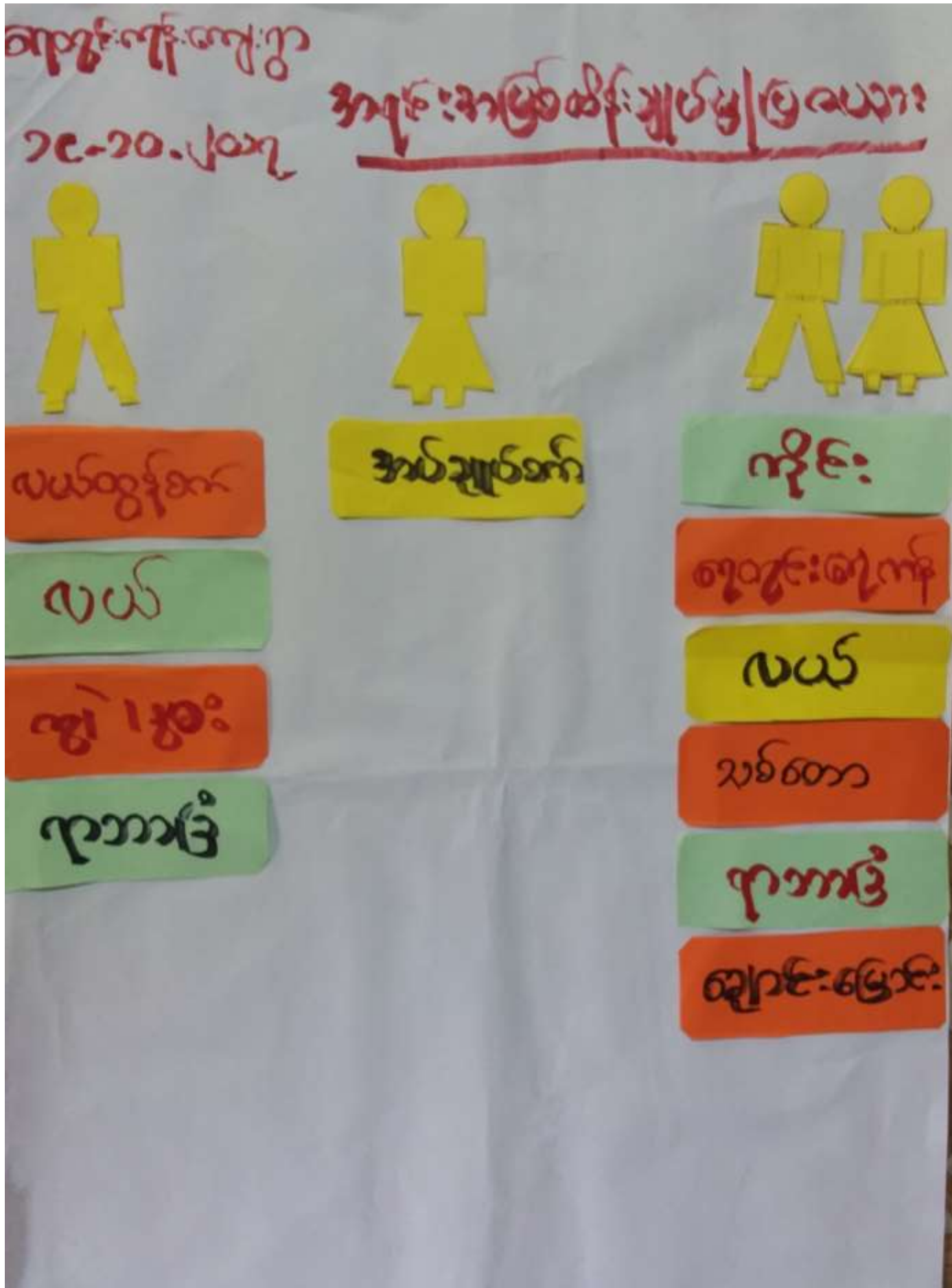
ရေတွင်းကုန်းကျေးရွာ၊ ကော့ကရိတ်ကျေးရွာအုပ်စု၊ ပေါင်မြို့နယ်။