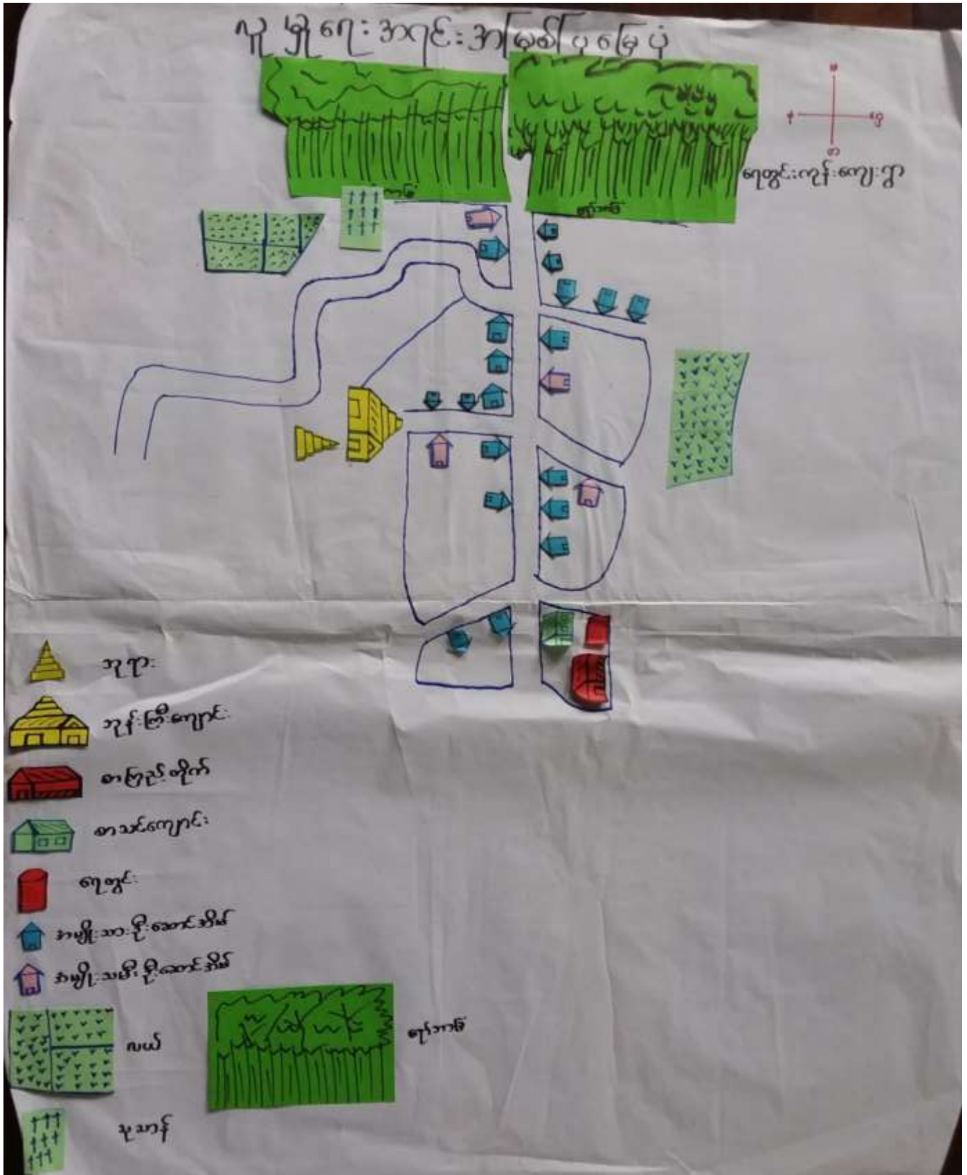
ရေတွင်းကုန်းကျေးရွာ၊ ကော့ကဒိုက်ကျေးရွာ အုပ်စု၊ ပေါင်မြို့နယ်။

၆။ ကျေးရွာ ဖွံ့ဖြိုးရေး အစီအစဉ်အတွက် အသုံးပြုခဲ့သော PRA tools များနှင့် တစ်ခုချင်းစီအတွက် သုံးသပ်ချက်များ