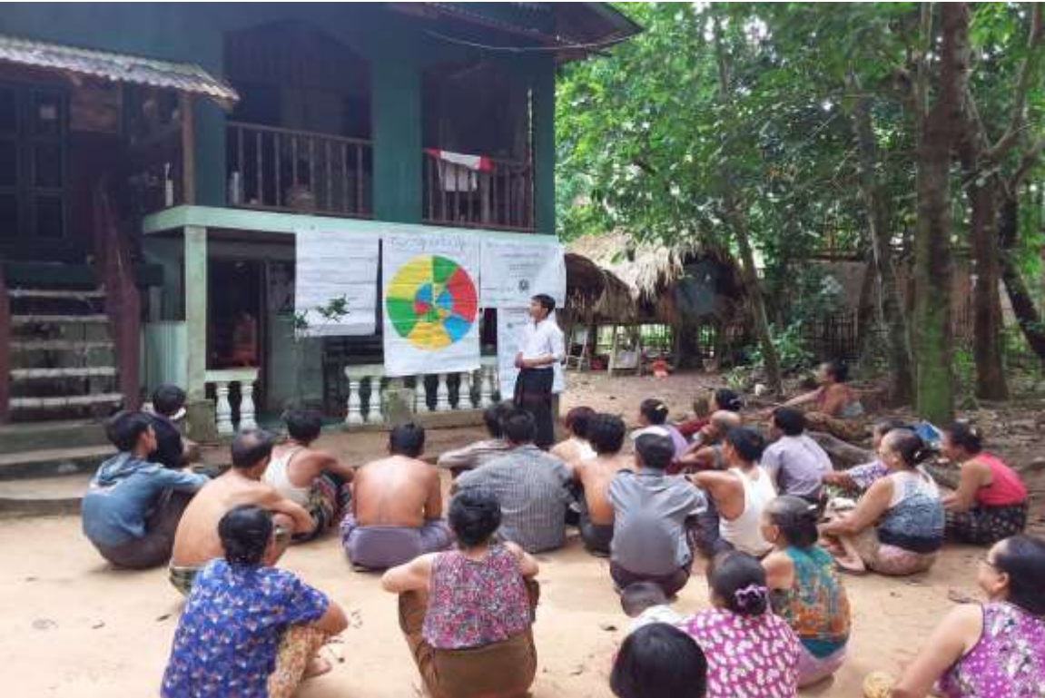
ရေတွင်းကုန်းကျေးရွာ၊ကော့ကဒိုက်ကျေးရွာအုပ်စု၊ပေါင်မြို့နယ်။