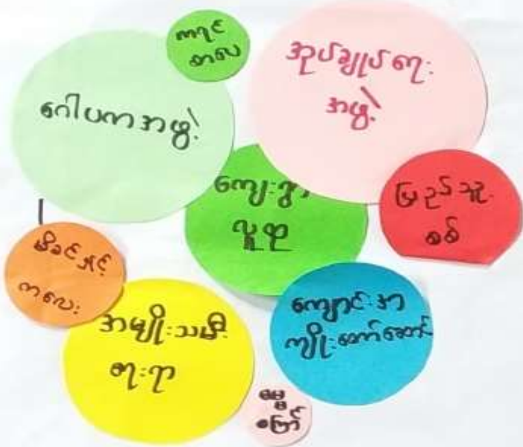
ရေတွင်းကုန်းကျေးရွာ၊ ကော့ကိတ်ကျေးရွာအုပ်စု၊ ပေါင်မြို့နယ်။

ကော့ကိတ်ကျေးဇူးအုပ်စု ရေတွင်းကုန်းကျေးရွာ