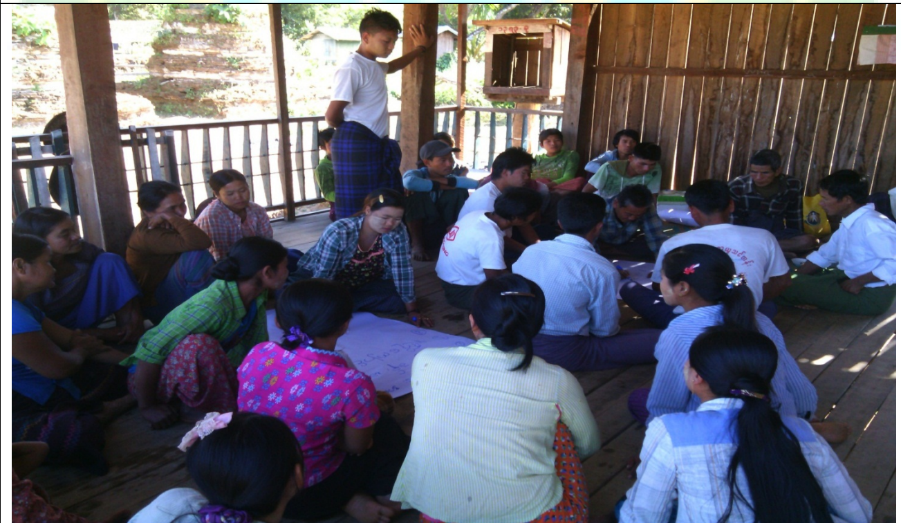
ဖွံ့ဖြိုးရေးအစီအစဉ်ရေးဆွဲခြင်းမှတ်တမ်းဓာတ်ပုံ