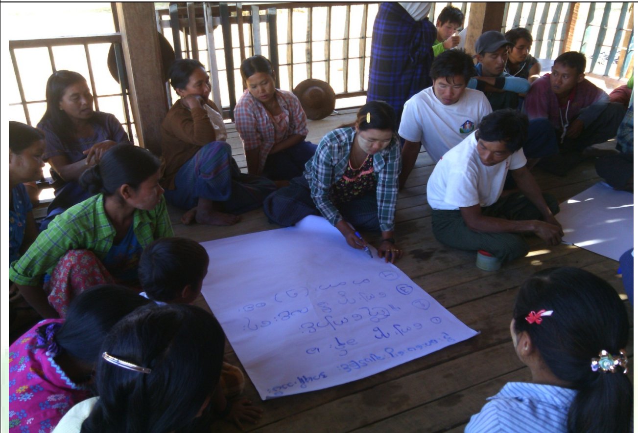
ဖွံ့ဖြိုးရေးအစီအစဉ်ရေးဆွဲခြင်းမှတ်တမ်းဓာတ်ပုံ