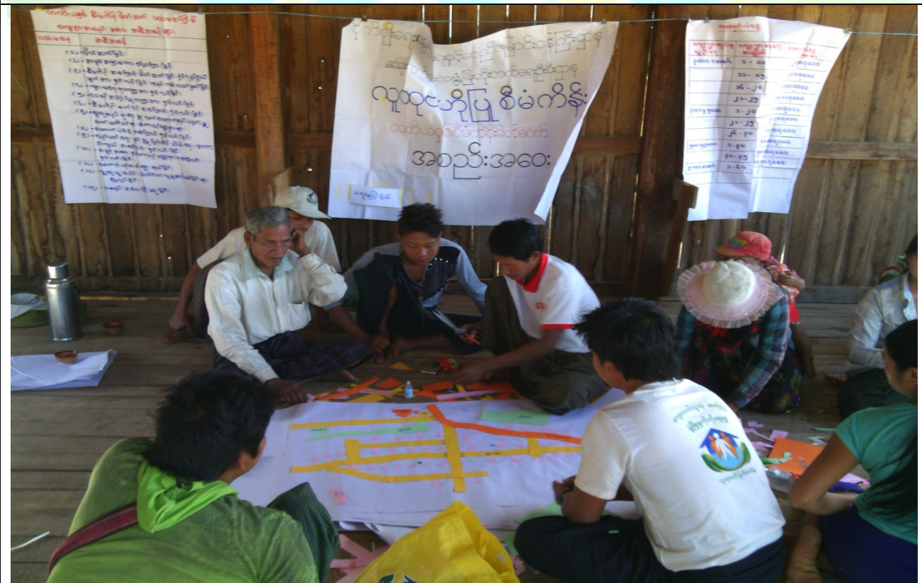
ထိခိုက်လွယ်အုပ်စုများ၏မှတ်တမ်းဓာတ်ပုံ