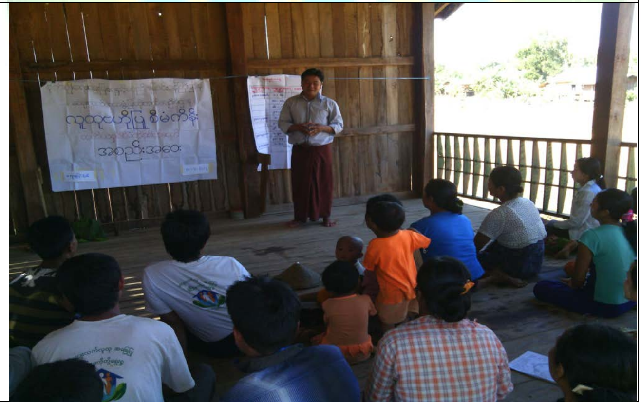
ကော်မတီရွေးချယ်ခြင်းမှတ်တမ်းခါတ်ပုံ