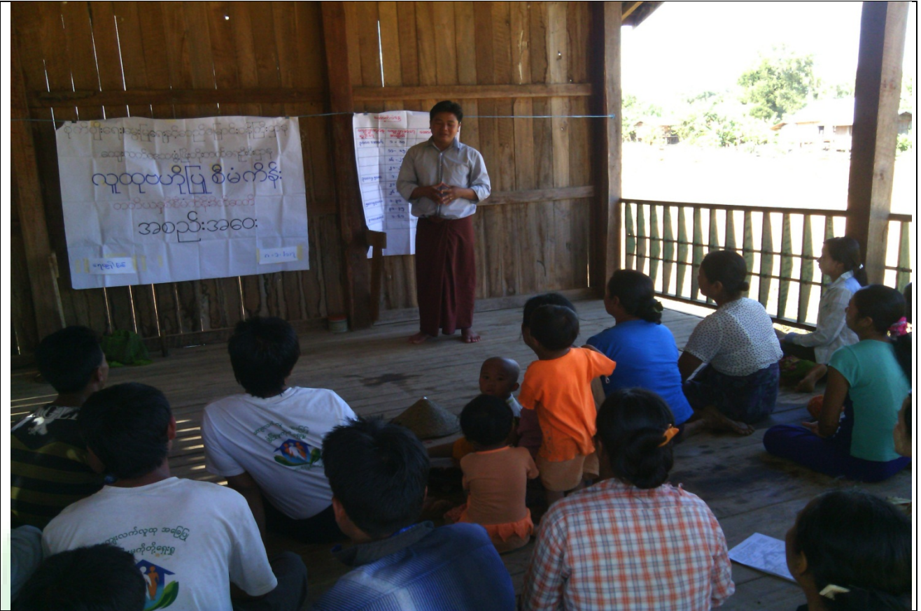
စေတနာ့ဝန်ထမ်းများရွေးချယ်ခြင်းမှတ်တမ်းခါတ်ပုံ