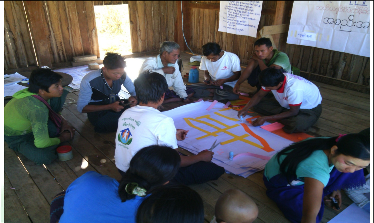
အမျိုးသားအုပ်စု၏မှတ်တမ်းခါတ်ပုံ