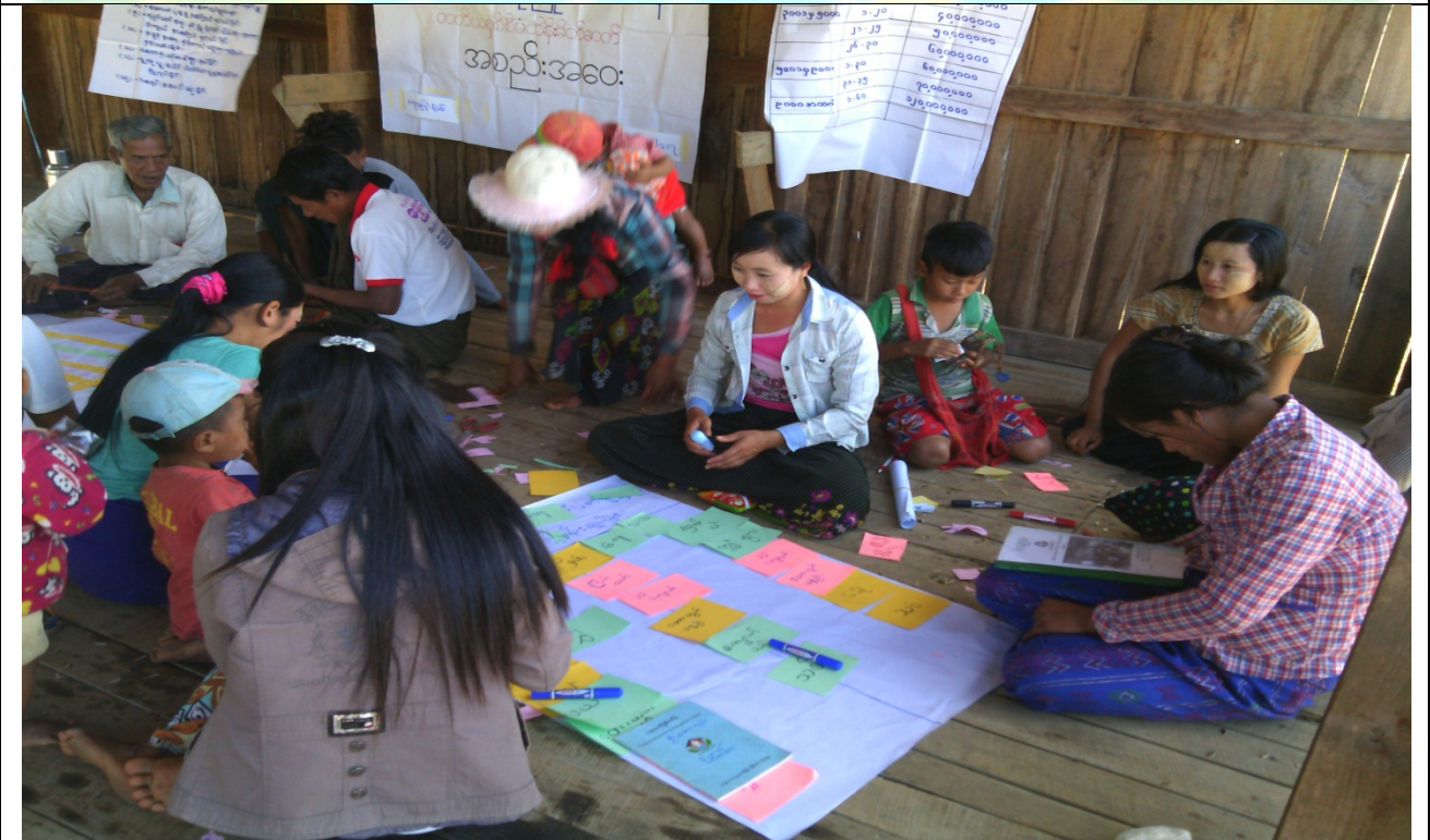
အမျိုးသမီးအုပ်စု၏မှတ်တမ်းခါတ်ပုံ