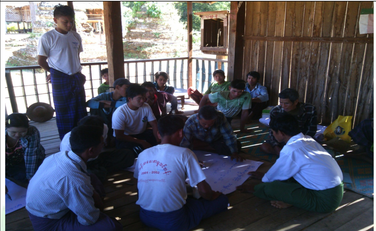
ဖွံ့ဖြိုးရေးအစီအစဉ်ရေးဆွဲခြင်းမှတ်တမ်းဓာတ်ပုံ