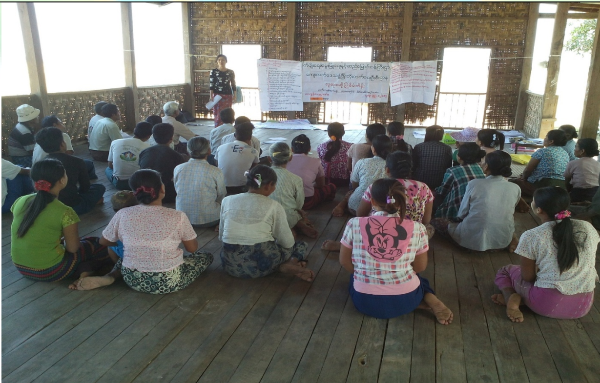
ကော်မတီရွေးချယ်ခြင်းမှတ်တမ်းခါတ်ပုံ