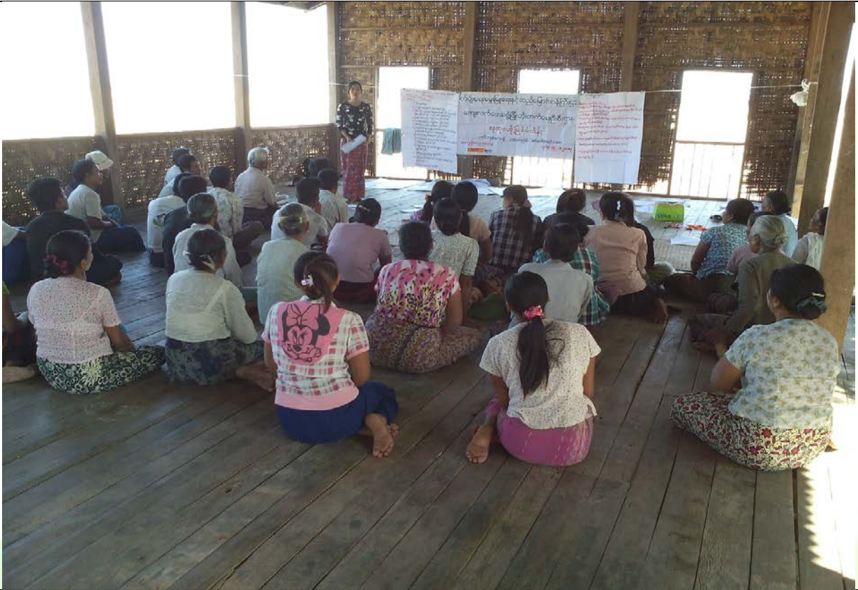
စေတနာ့ဝန်ထမ်းများရွေးချယ်ခြင်းမှတ်တမ်းခါတ်ပုံ