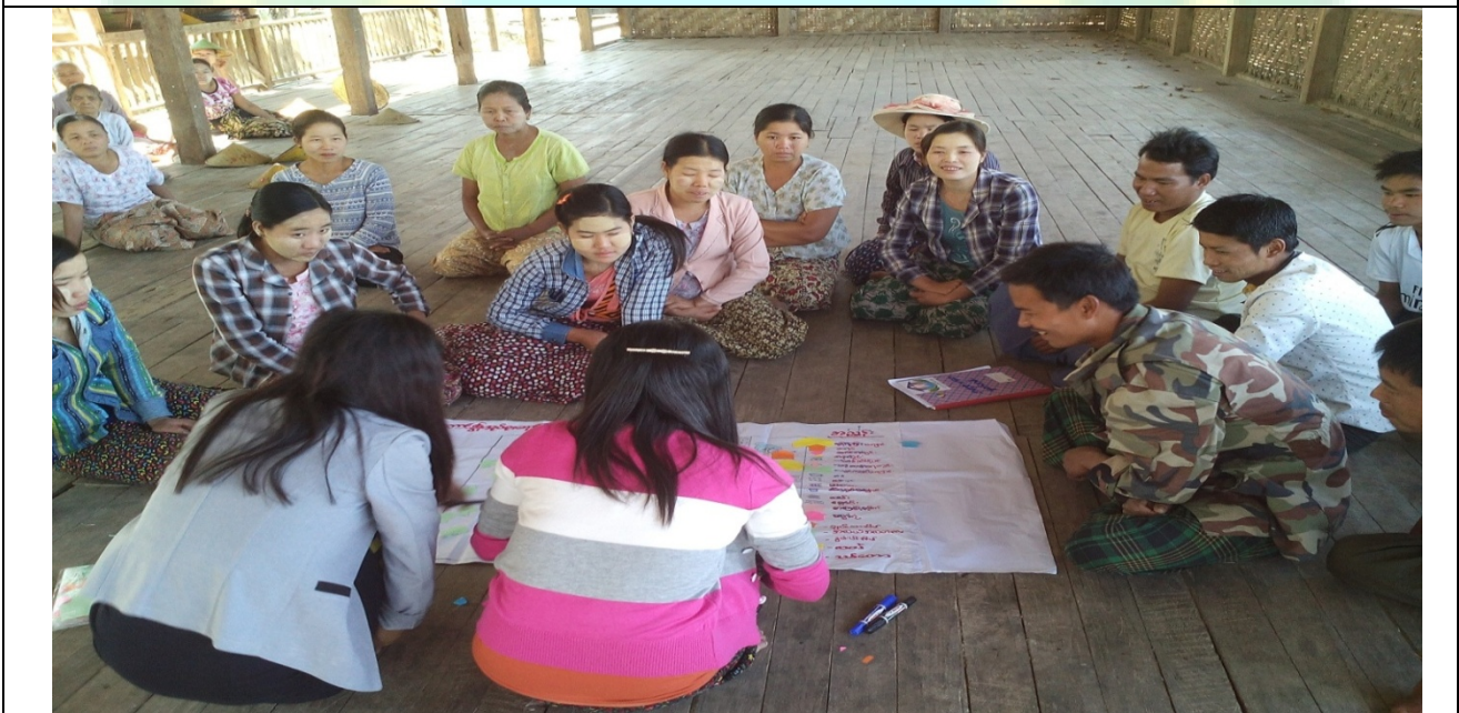
အမျိုးသမီးအုပ်စု၏မှတ်တမ်းဓါတ်ပုံ