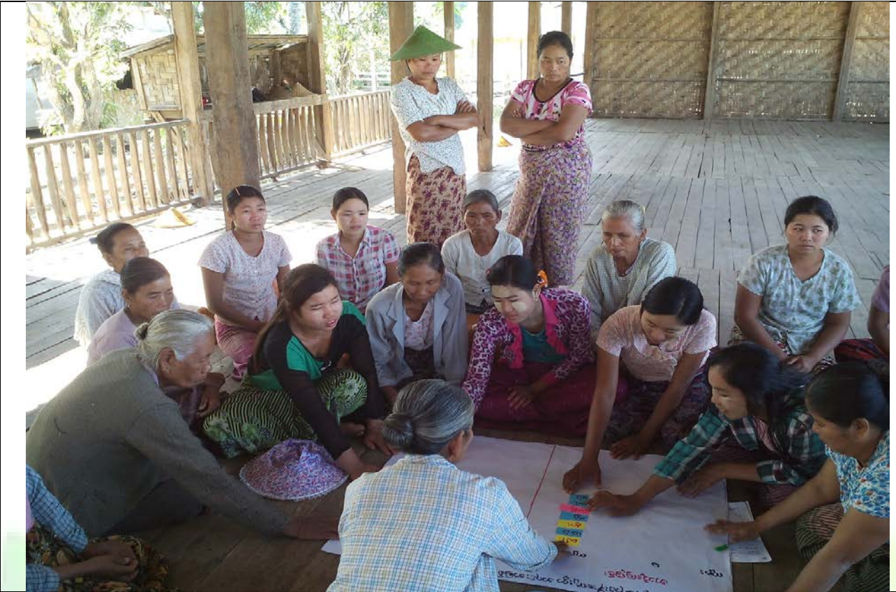
ဖွံ့ဖြိုးရေးအစီအစဉ်ရေးဆွဲခြင်းမှတ်တမ်းဓာတ်ပုံ