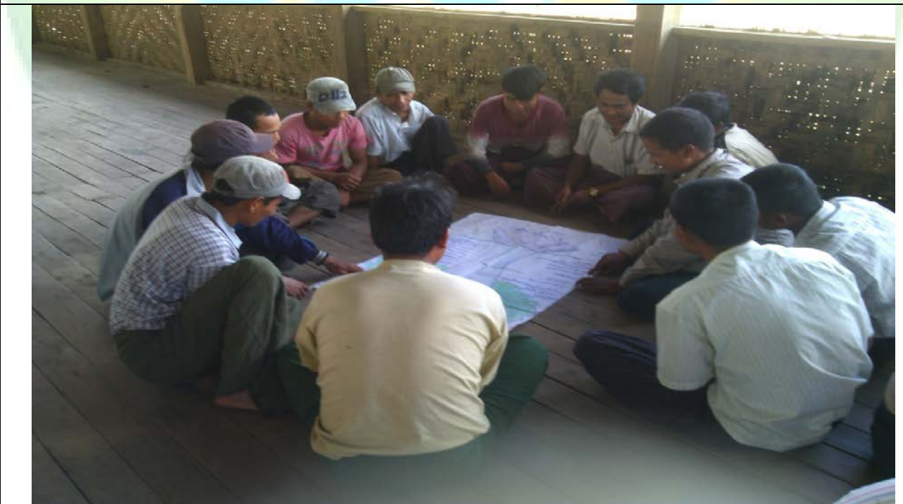
ဖွံ့ဖြိုးရေးအစီအစဉ်ရေးဆွဲခြင်းမှတ်တမ်းဓာတ်ပုံ