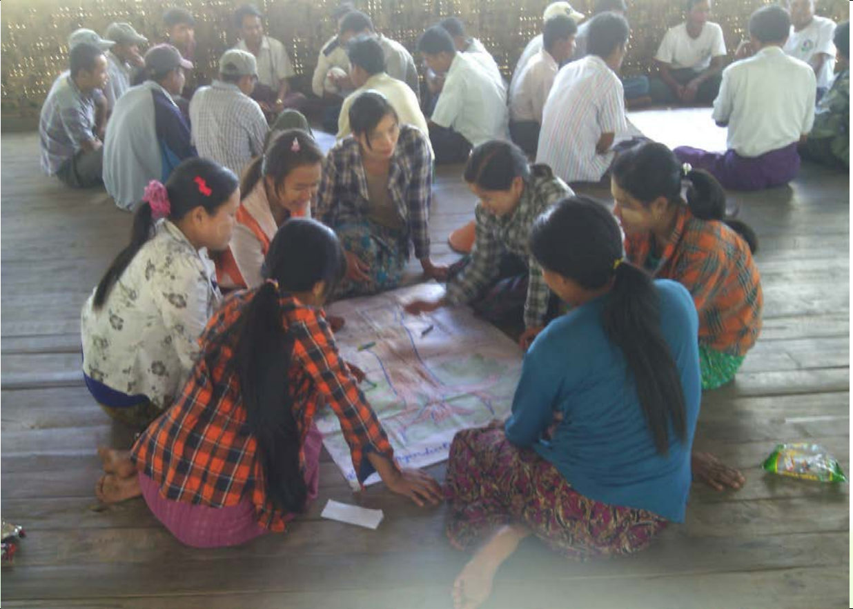
လူငယ်အုပ်စု၏မှတ်တမ်းခါတ်ပုံ