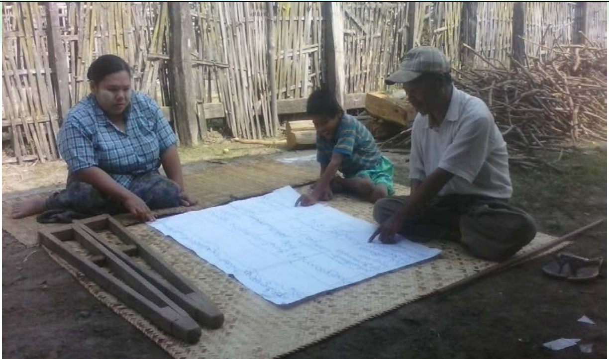
ထိခိုက်လွယ်အုပ်စုများ၏မှတ်တမ်းခါတ်ပုံ