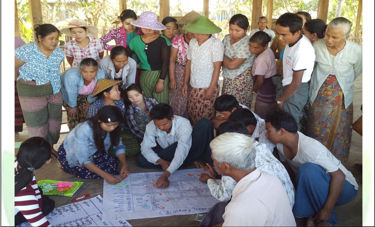
အမျိုးသားအုပ်စု၏မှတ်တမ်းဓါတ်ပုံ