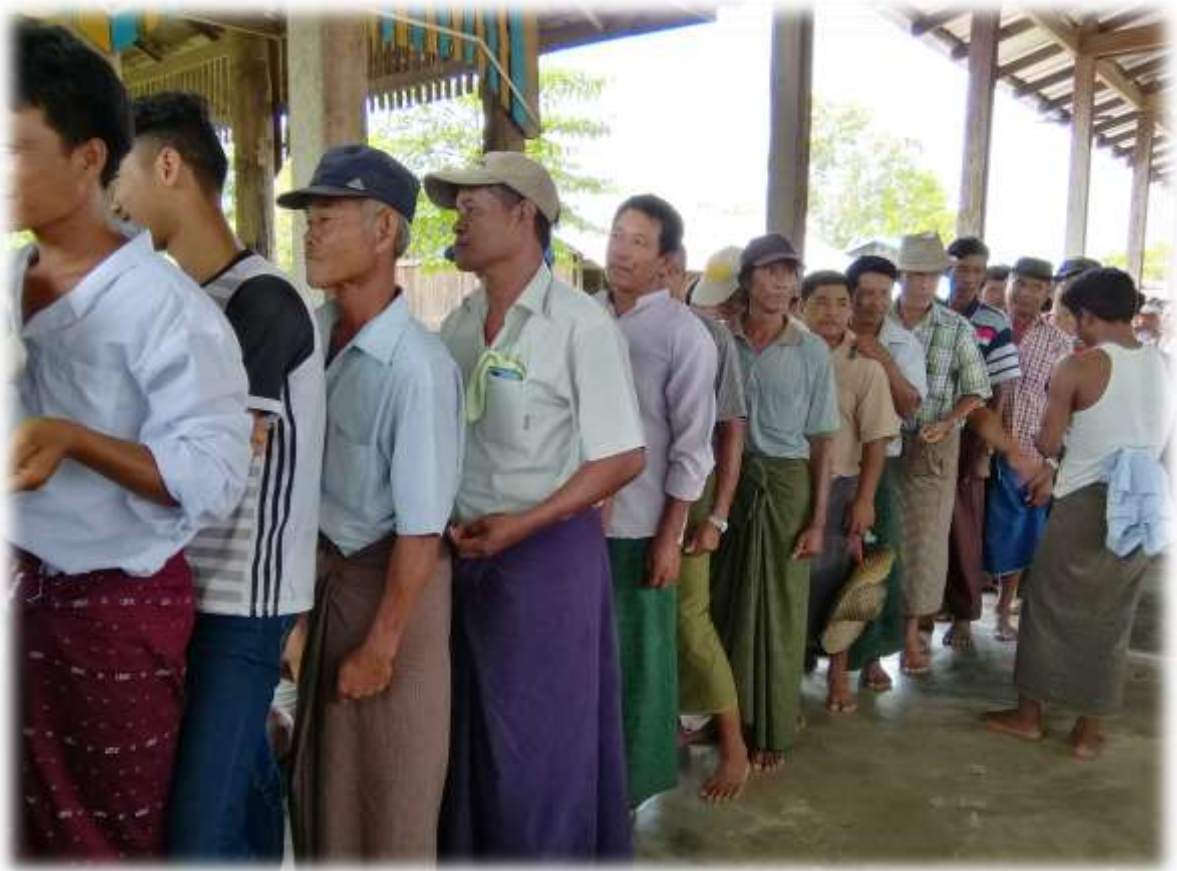
၇။ ကော်မတီဝင်များရွေးချယ်ခြင်းနှင့် ကျေးရွာပွဲ.ပြီးရေးအစီအစဉ်ဆောင်ရွက်မှု မှတ်တမ်းဓာတ်ပုံများ