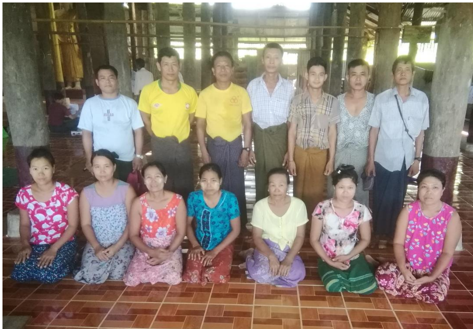
မီးလောင်ကုန်းကျေးရွာအုပ်စု၊ရေတွင်းကုန်းကျေးရွာ