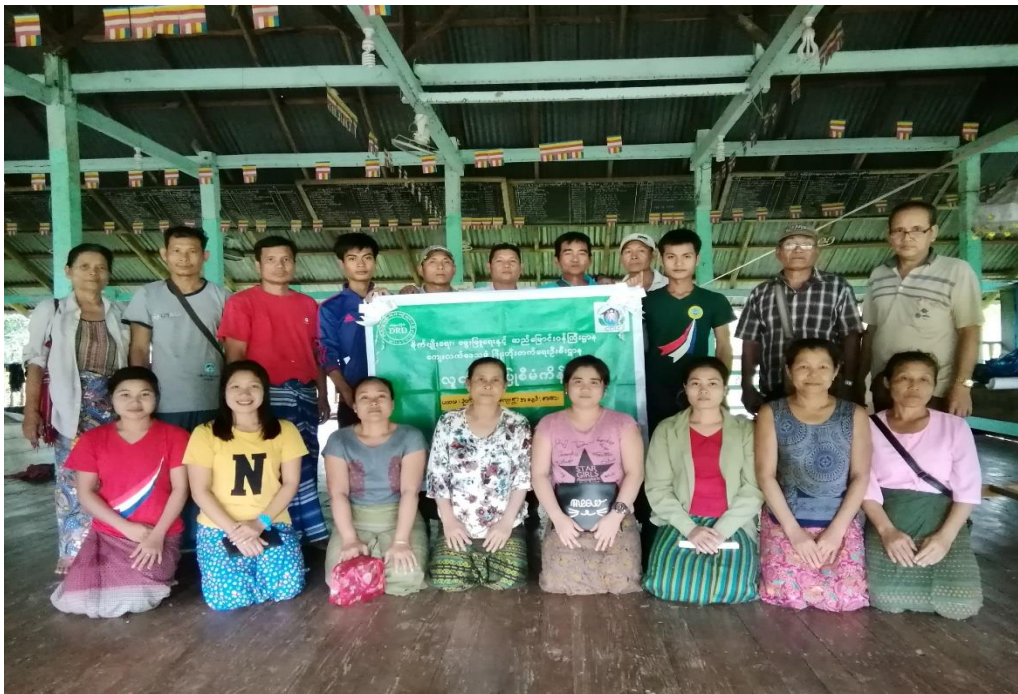
ကရင်ပြည်နယ်၊ ကော့ကရိတ်မြို့နယ်၊ ရေပူကြီးကျေးရွာအုပ်စု ရေပူကြီးကျေးရွာ၏ ဖွံ့ဖြိုးရေးအစီအစဉ် ၂၀၂၀ပြည့်နှစ် (တတိယနှစ်စက်ဝန်း)