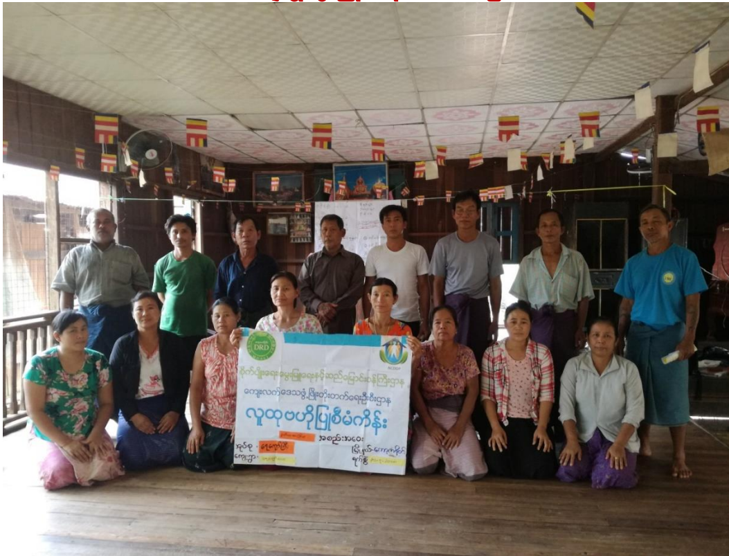
ရေကျော်ကြီးကျေးရွာအုပ်စု၊ ရေကျော်ကြီးလေးကျေးရွာ ၂၀၁၉ ခုနှစ်

လူထုဗဟိုပြုစီမံကိန်း ကော့ကရိတ်မြို့နယ်၊ ကရင်ပြည်နယ် ကျေးရွာဖွံ့ဖြိုးရေးအစီအစဉ်