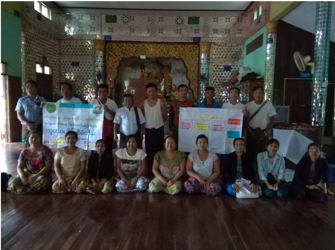
ရေကျော်ကြီးကျေးရွာအုပ်စု၊ ရေကျော်ကြီးကျေးရွာ

လူထုဗဟိုပြုစီမံကိန်း ကော့ကရိတ်မြို့နယ်၊ ကရင်ပြည်နယ် ကျေးရွာဖွံ့ဖြိုးရေးအစီအစဉ်