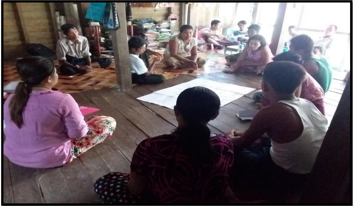
၇။ ကော်မတီဝင်များရွေးချယ်ခြင်းနှင့် ကျေးရွာဖွံ့ဖြိုးရေးအစီအစဉ်ဆောင်ရွက်မှုမှတ်တမ်းဓါတ်ပုံများ