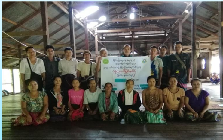
ကရင်ပြည်နယ်၊ ကော့ကရိတ်မြို့နယ်၊ ဝင်းကကျေးရွာအုပ်စု ဝင်းကကျေးရွာ၏ ဖွံ့ဖြိုးရေးအစီအစဉ် ၂၀၂၀ပြည့်နှစ် (တတိယနှစ်စက်ဝန်း)