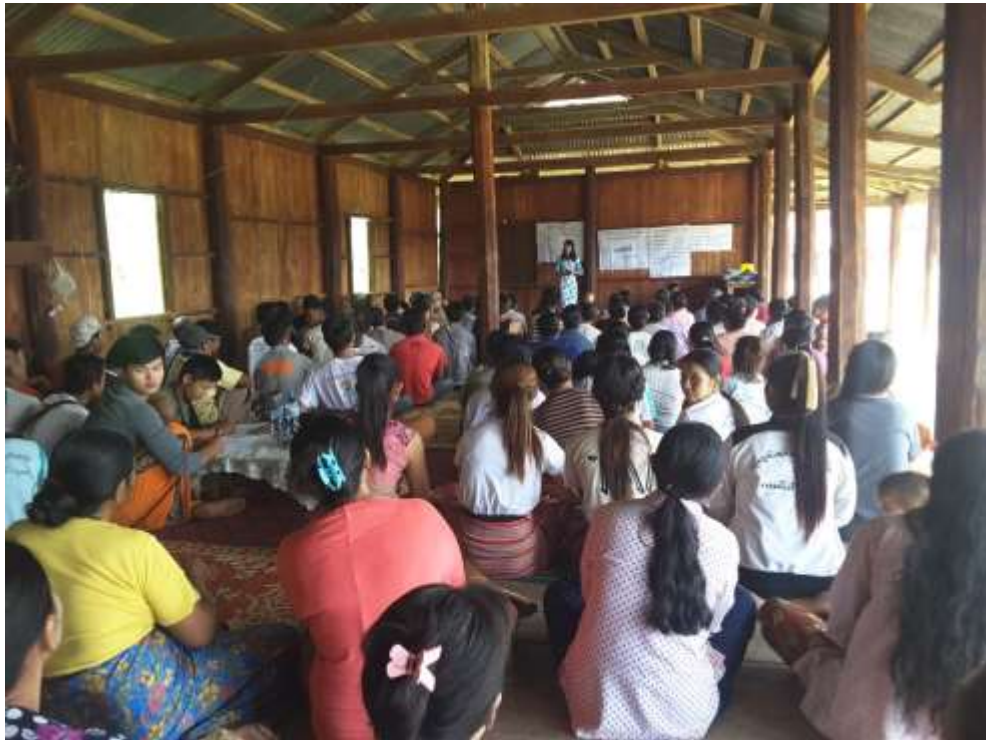
၈။ ကျေးရွာအချက်အလက် (ပုံစံ ၈-၁)