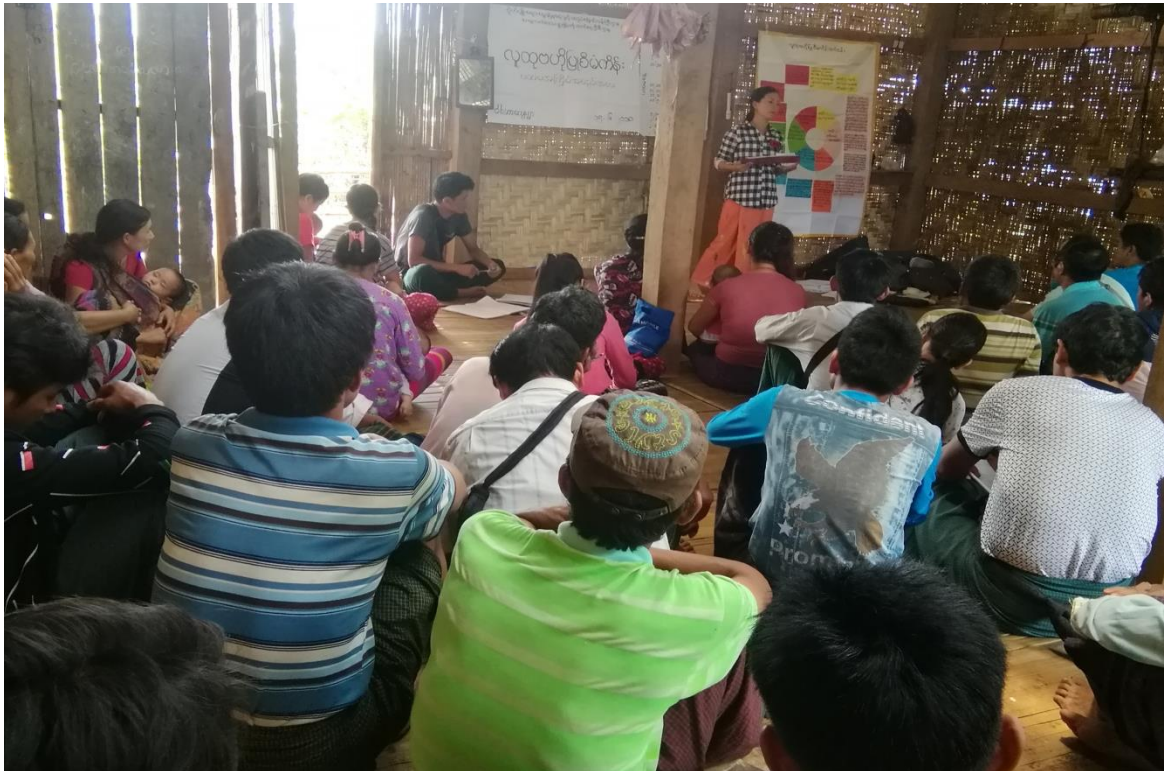
ကျေးရွာကော်မတီဝင်များရွေးချယ်ဆောင်ရွက်ထားခြင်း