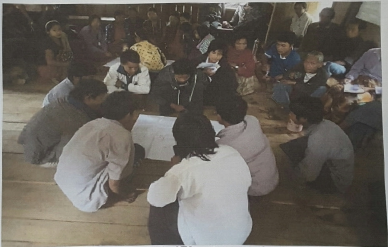
ပိကြတ်ချောင်းကျေးရွာ လူမှုဆန်းစစ်ခြင်း အမျိုးသားများ ပင့်ကူအိမ်ရေးဆွဲနေစဉ်