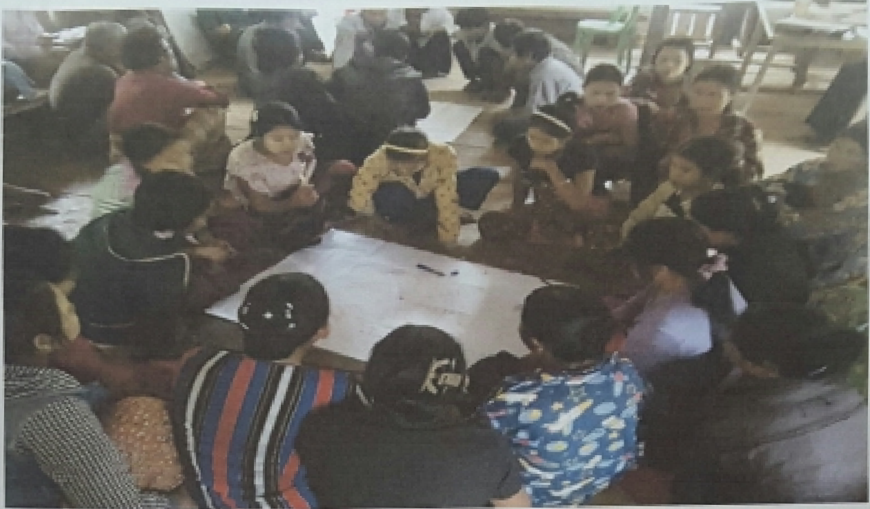
ပိကြတ်ချောင်းကျေးရွာ လူမှုဆန်းစစ်ခြင်း အမျိုးသမီးများ ပင့်ကူအိမ်ရေးဆွဲနေစဉ်