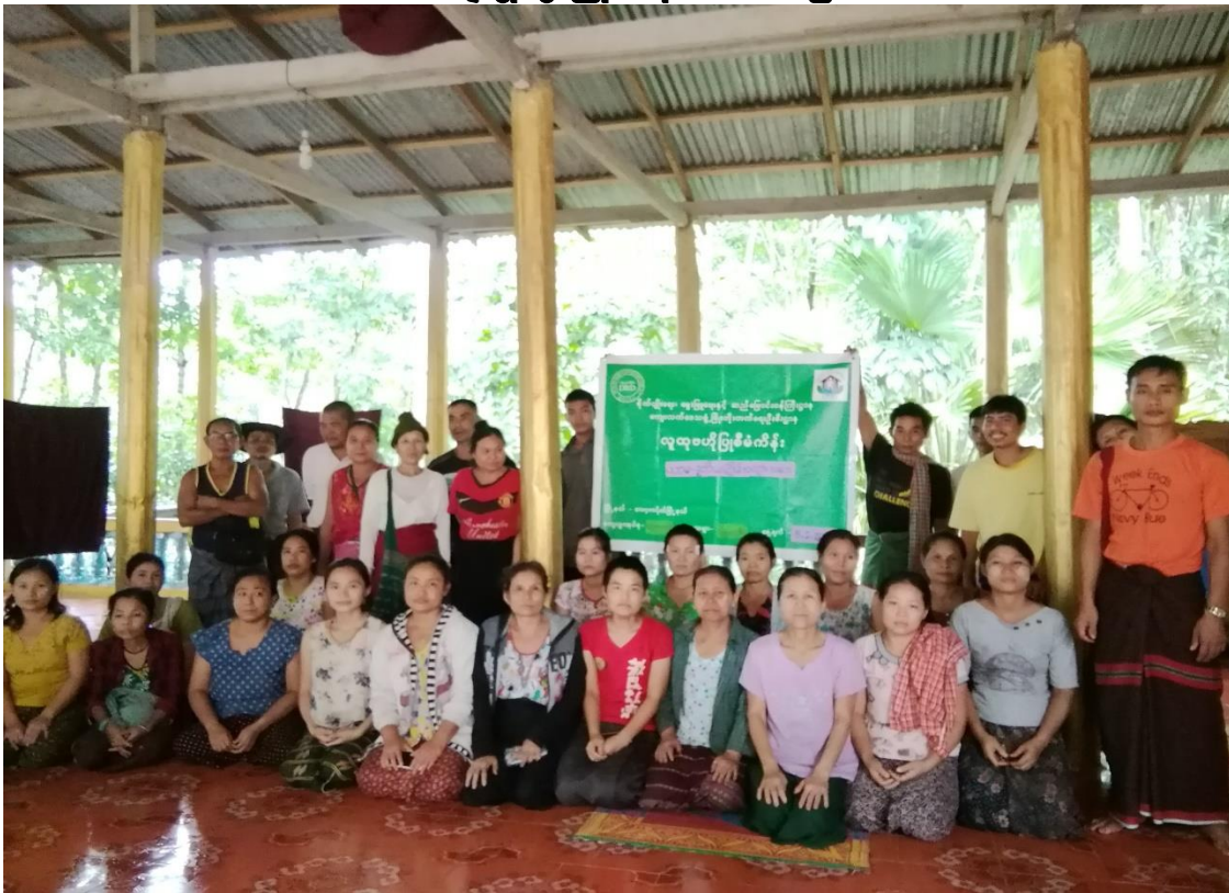
မြောက်ကြာအင်းကျေးရွာအုပ်စု၊ ဝိဇ္ဇာကုန်းကျေးရွာ ၂၀၁၉ - ခုနှစ်

လူထုဗဟိုပြုစီမံကိန်း ကော့ကရိတ်မြို့နယ်၊ ကရင်ပြည်နယ် ကျေးရွာဖွံ့ဖြိုးရေးအစီအစဉ်