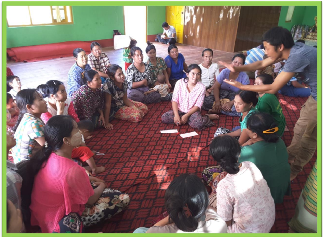
လောစီကျေးရွာ ၊ နောင်ပုလဲကျေးရွာအုပ်စု