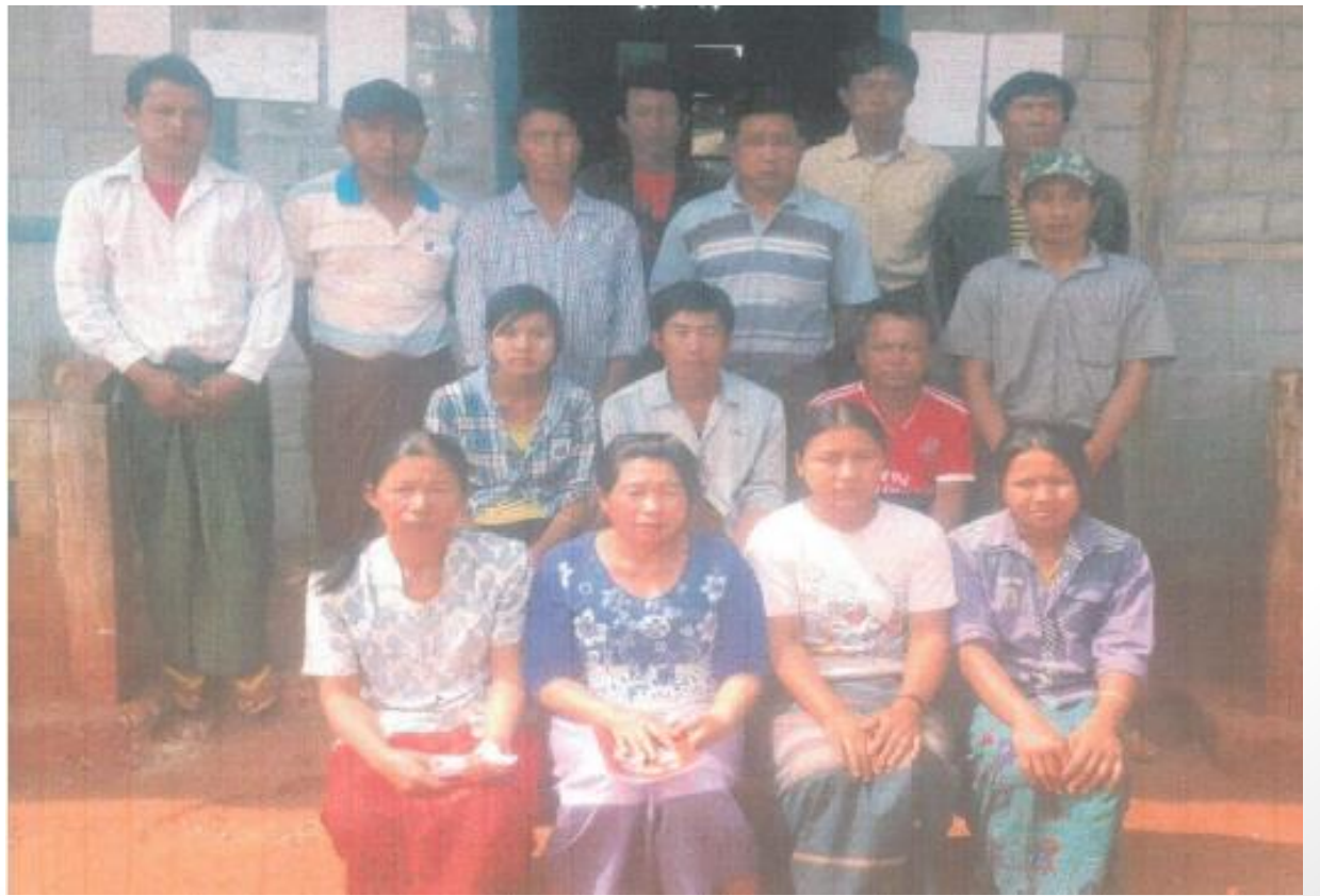
ဒေါ်တင်ကျေးရွာ ဆောင်ရွက်လာသောကျေးရွာအုပ်စု