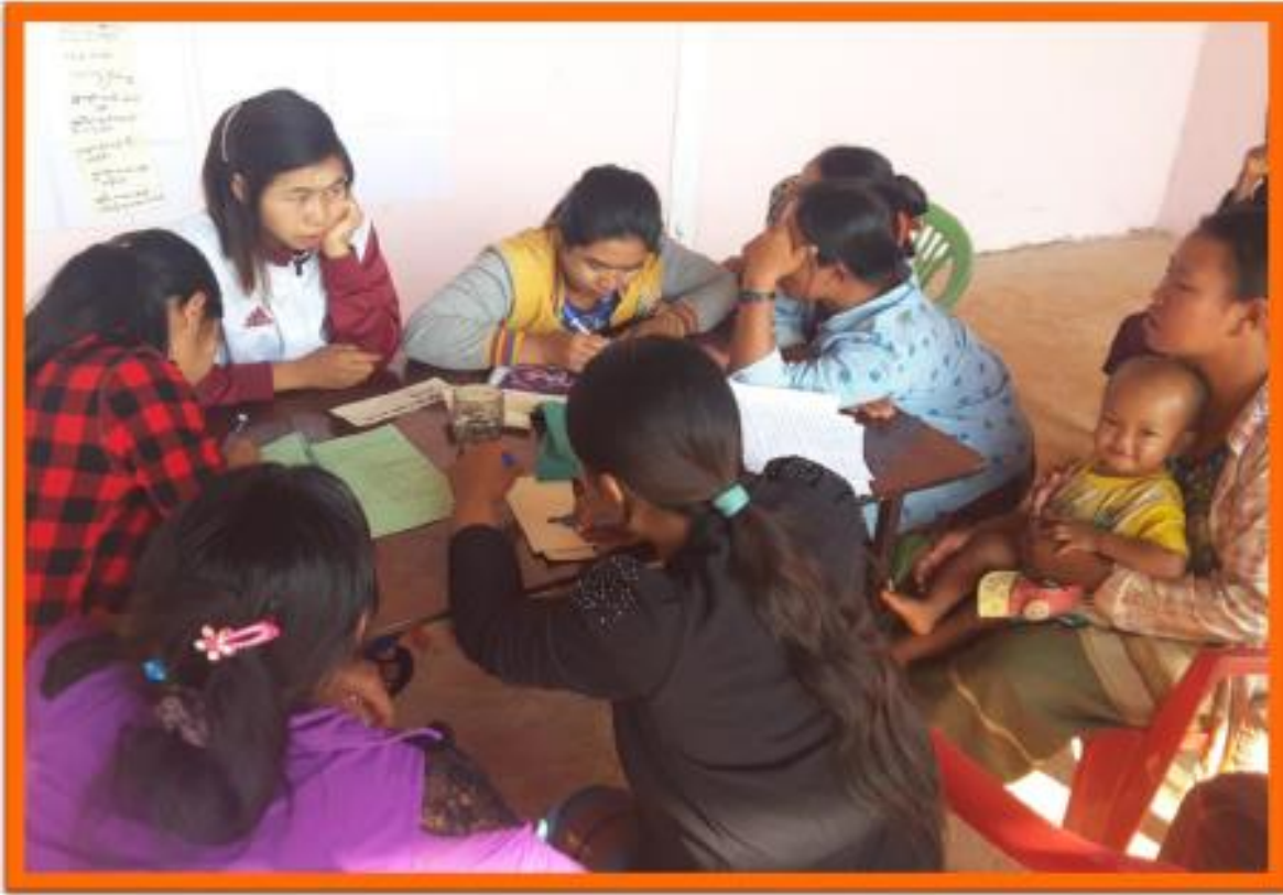
ဒေါ်တင်ကျေးရွာ၊ ဆောင်ရွက်လာကျေးရွာအုပ်စု