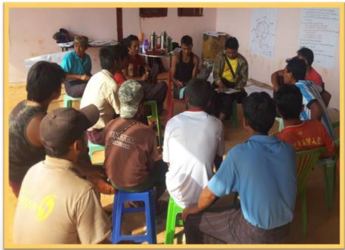
ကျေးရွာဖွံ့ဖြိုးရေးအစီအစဉ်