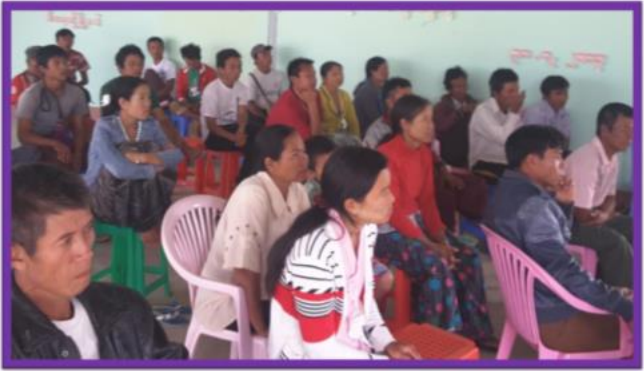
ဒေါ်ခလိုက်လင်းကျေးရွာ ၊ ငွေတောင်ကျေးရွာအုပ်စု