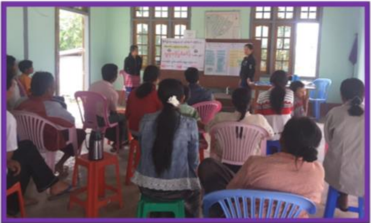
ကျေးရွာဖွံ့ဖြိုးရေးအစီအစဉ်