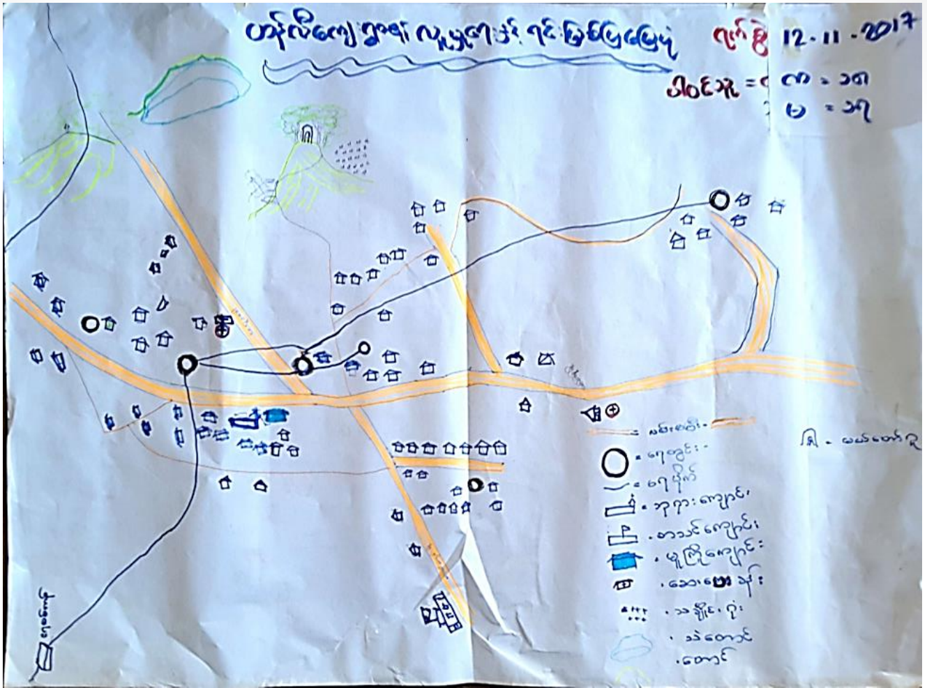
ပါဝင်ဆွေးနွေးသူ ကျား ( ၁၈)၊ မ (၁၇)