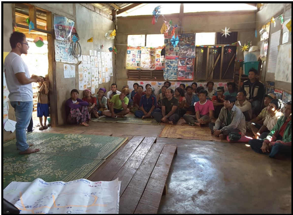
ဟန်လီကျေးရွာ ၊ ဒေါ်ရောက်ခူကျေးရွာအုပ်စု