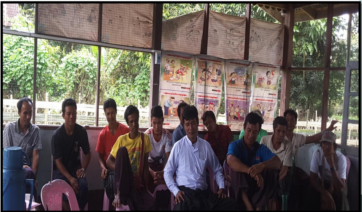
ဒေါ်တင်ကူးကျေးရွာအုပ်စု ဒေါ်တင်ကူးကျေးရွာ (ဟောင်း) ကျေးရွာ