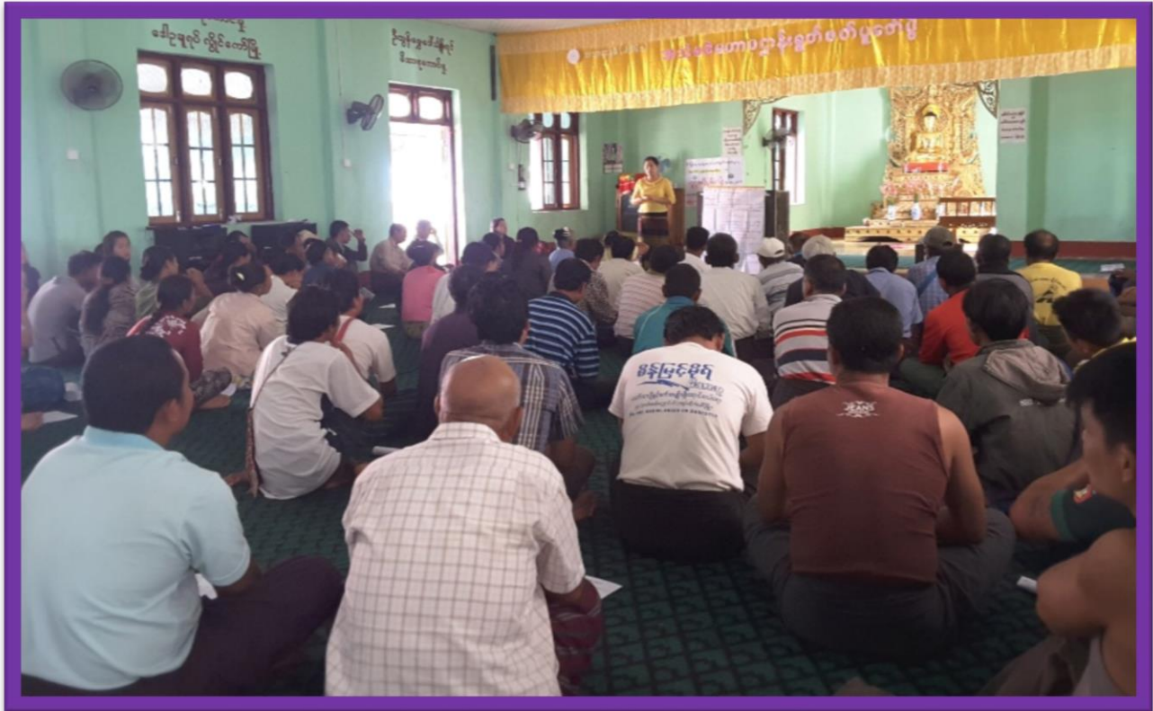
ငွေတောင်ကျေးရွာ၊ ငွေတောင်ကျေးရွာအုပ်စု