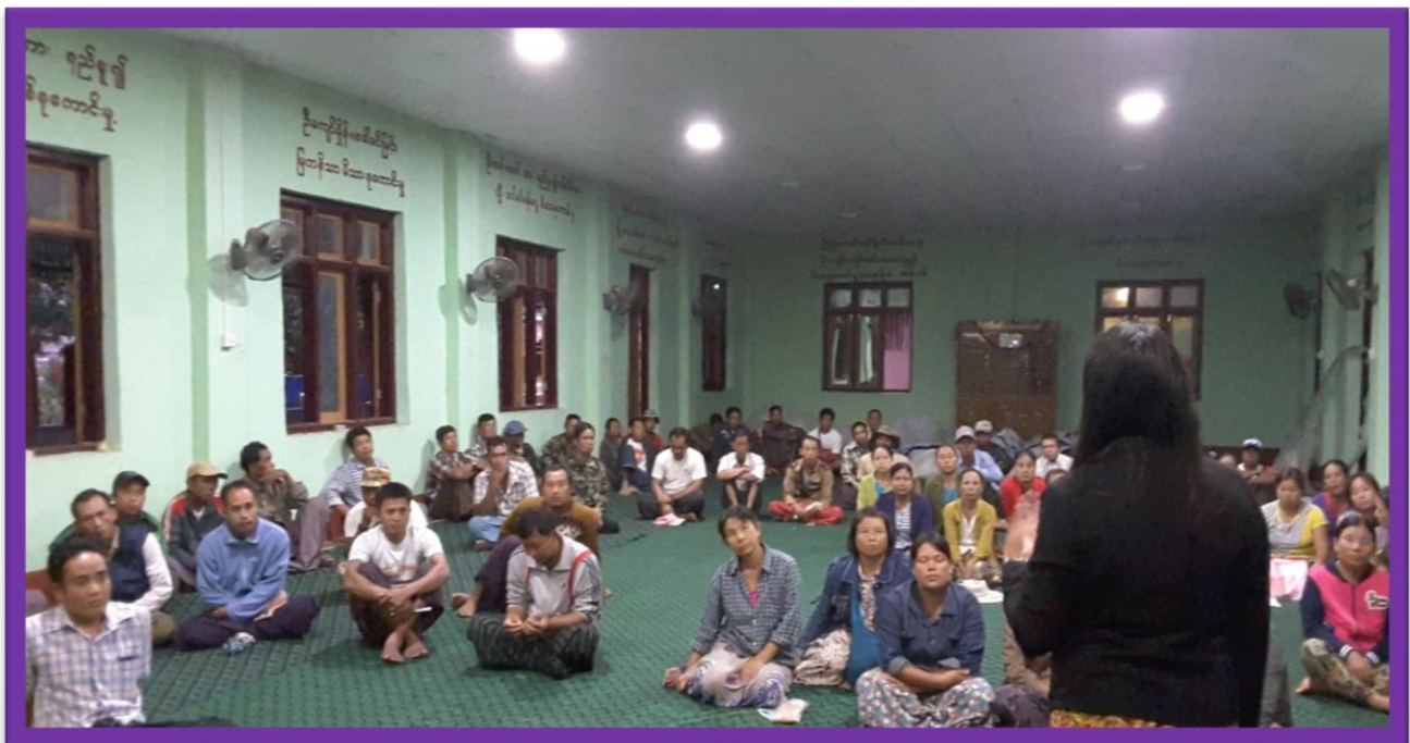
ကျေးရွာဖွံ့ဖြိုးရေးအစီအစဉ်