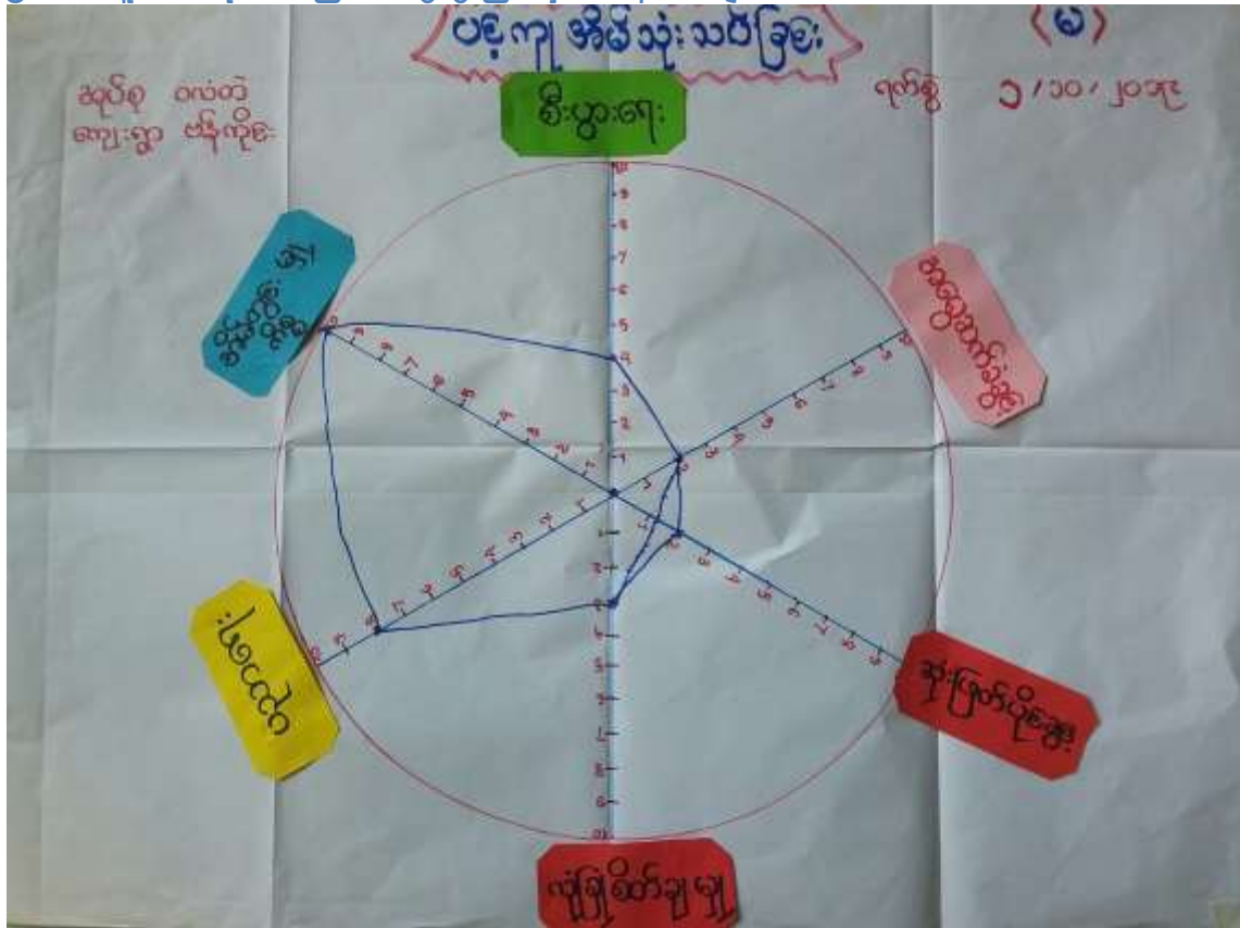
၆.၅။ ပင့်ကူအိမ်သုံးသပ်ခြင်းဆွေးနွေးခြင်းနှင့်ဆန်းစစ်ချက်