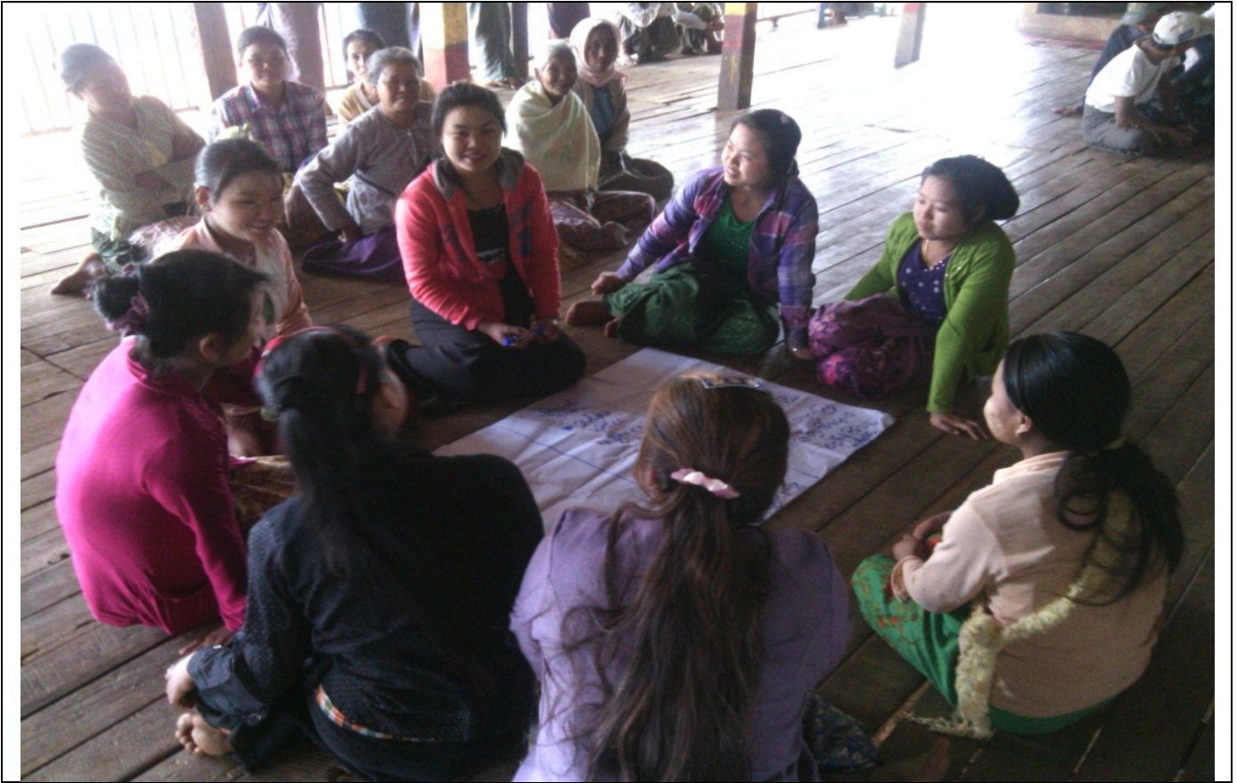
လူငယ်အုပ်စု၏မှတ်တမ်းခါတ်ပုံ