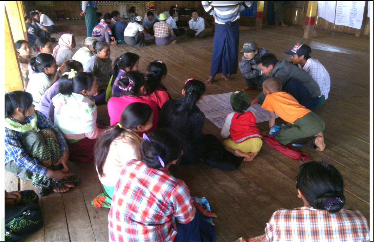
ဖွံ့ဖြိုးရေးအစီအစဉ်ရေးဆွဲခြင်မှတ်တမ်းခါတ်ပုံ