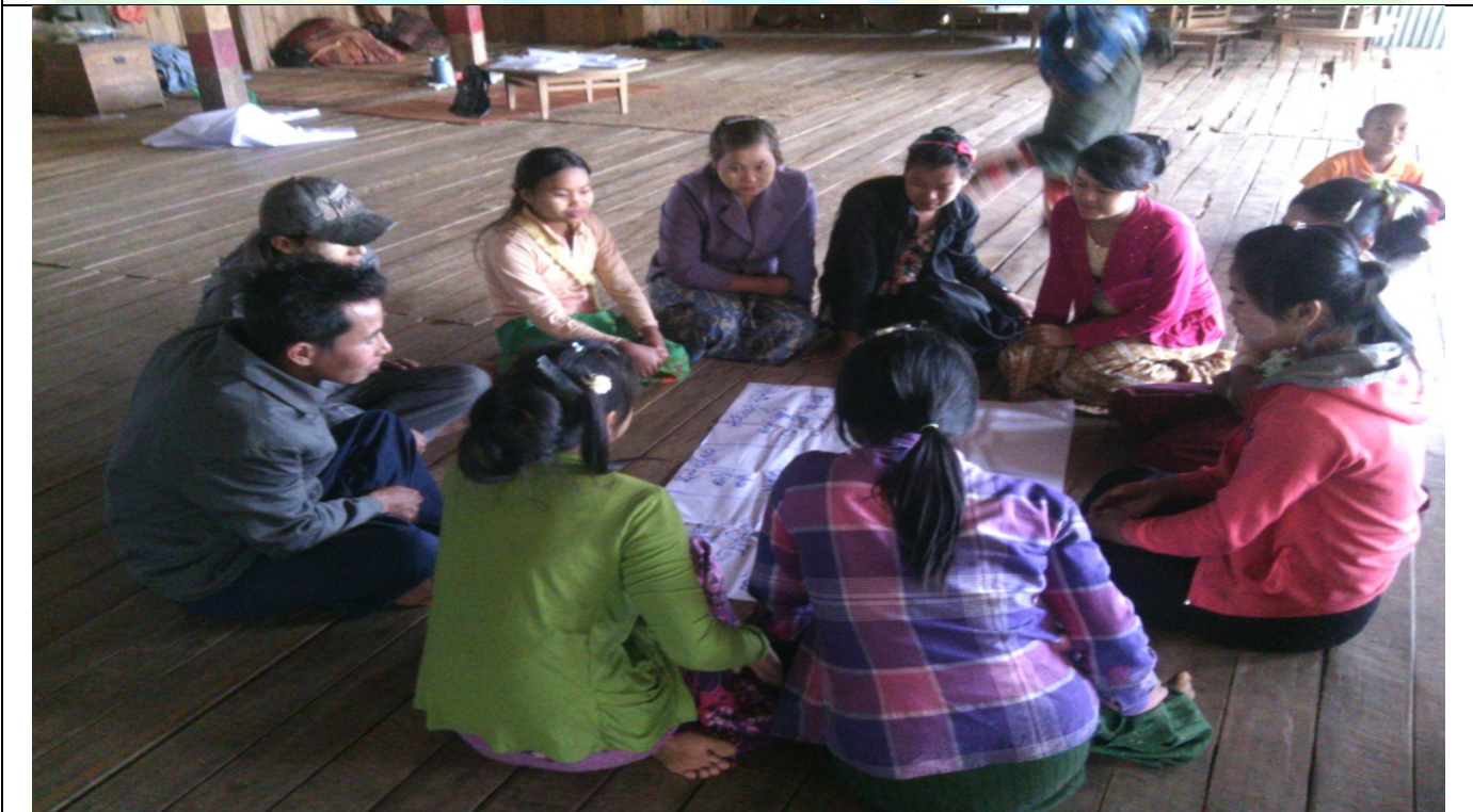
အမျိုးသမီးအုပ်စု၏မှတ်တမ်းခါတ်ပုံ