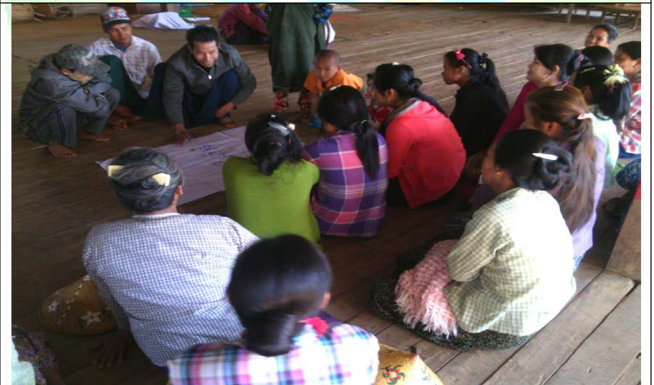
ဖွံ့ဖြိုးရေးအစီအစဉ်ရေးဆွဲခြင်မှတ်တမ်းခါတ်ပုံ