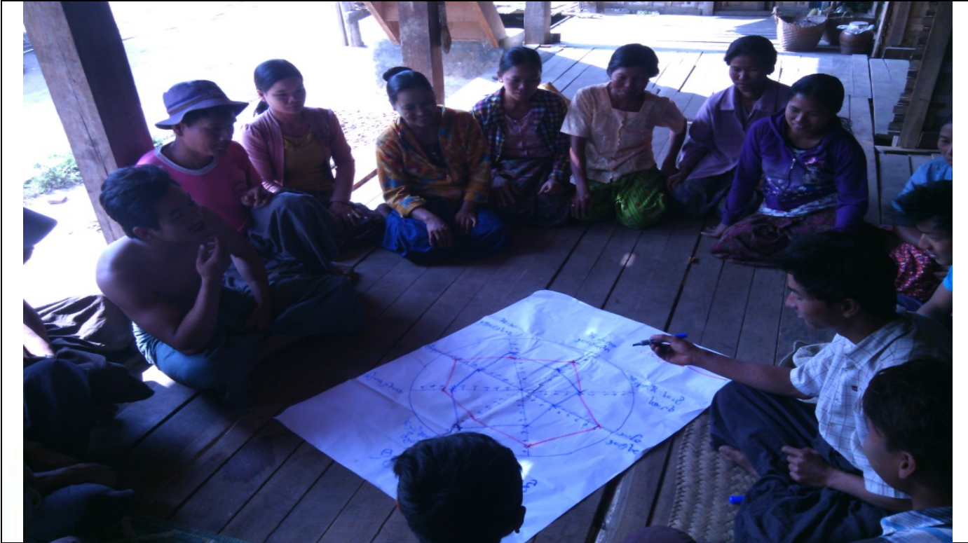
အမျိုးသားအုပ်စု၏မှတ်တမ်းခါတ်ပုံ