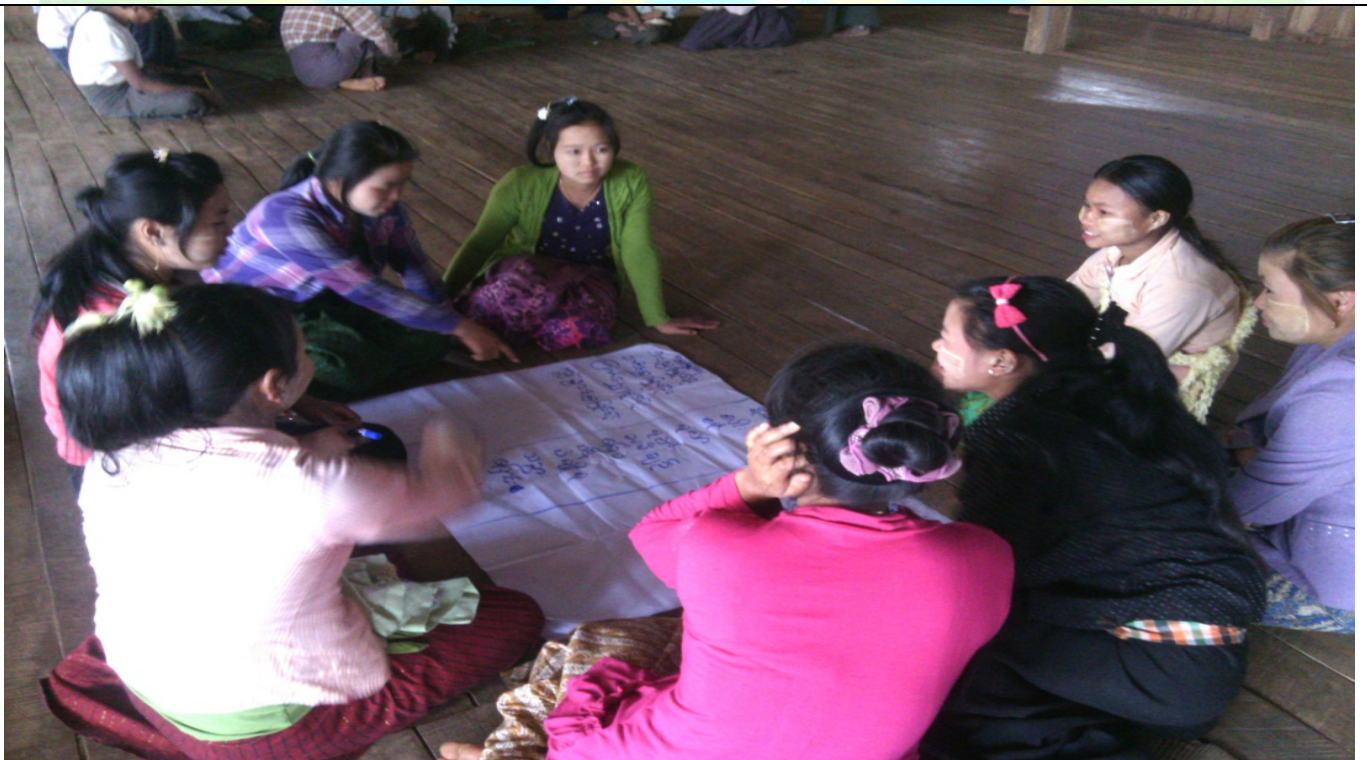
ထိခိုက်လွယ်အုပ်စုများ၏မှတ်တမ်းခါတ်ပုံ