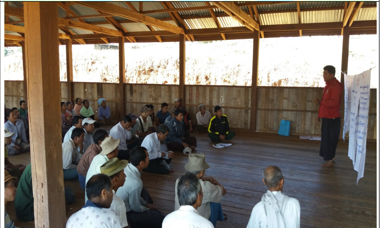
ကော်မတီရွေးချယ်ခြင်းမှတ်တမ်းခါတ်ပုံ