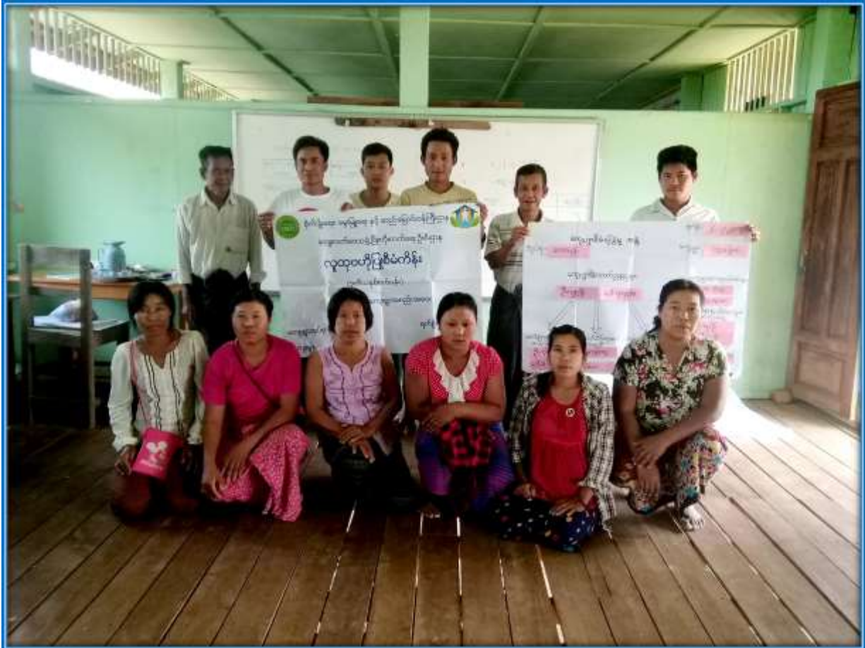
၇။ ကော်မတီဝင်များရွေးချယ်ခြင်းနှင့် ကျေးရွာဖွံ့ဖြိုးရေးအစီအစဉ်ဆောင်ရွက်မှု မှတ်တမ်းဓါတ်ပုံများ