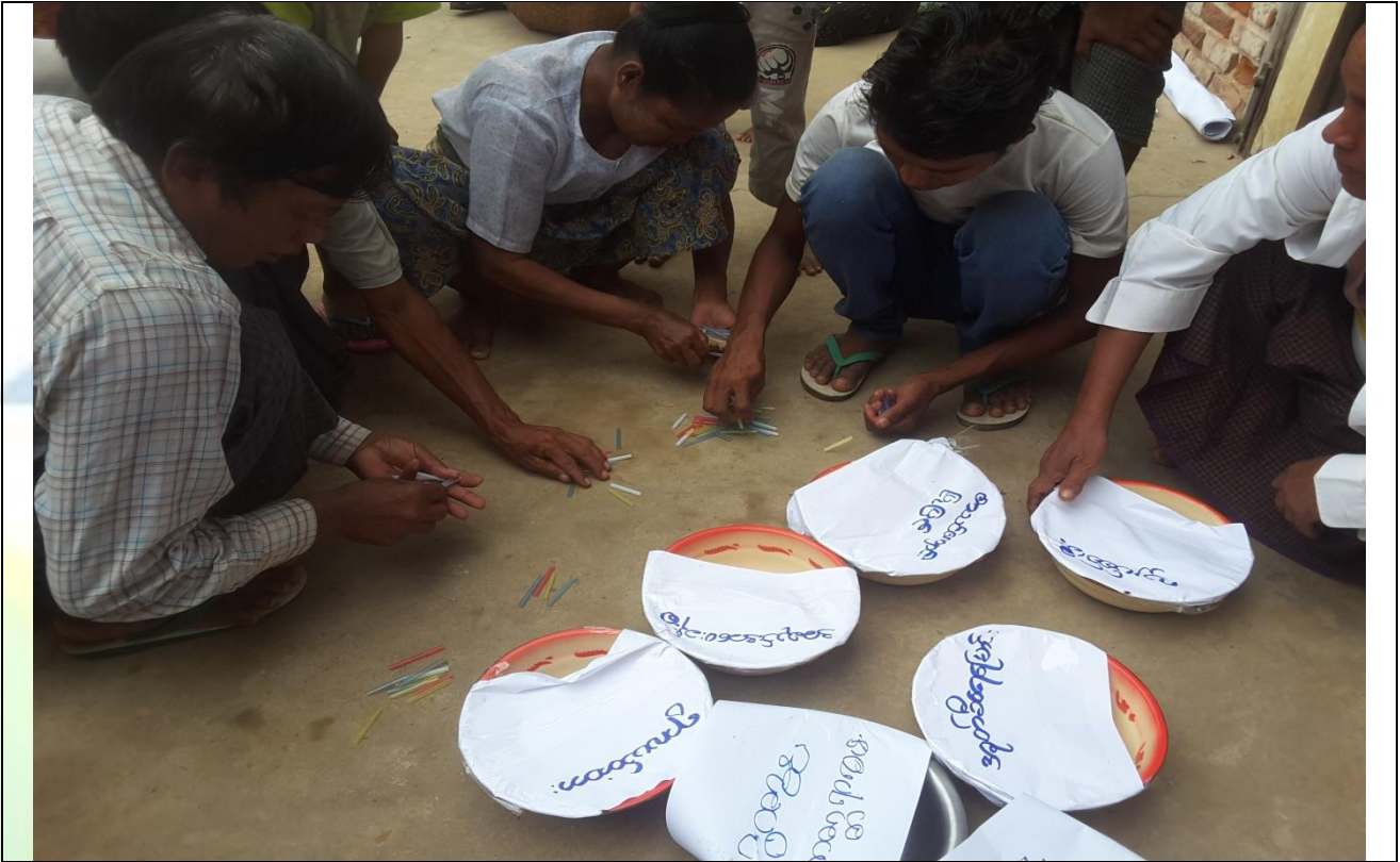
ကော်မတီရွေးချယ်ရန် မဲရေတွက်နေစဉ်