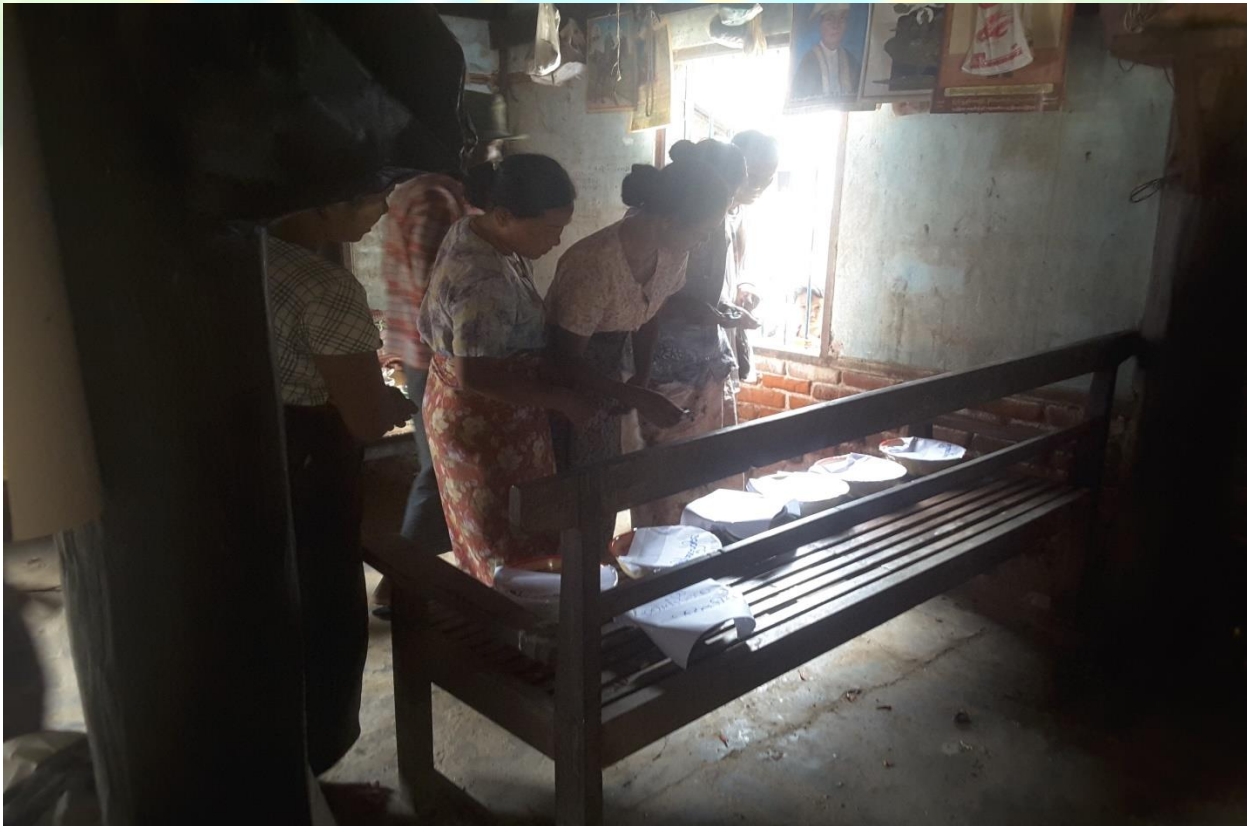
ကျေးရွာဖွံ့ဖြိုးရေးဦးစားပေးမဲပေးရန်တန်းစီနေကြစဉ်