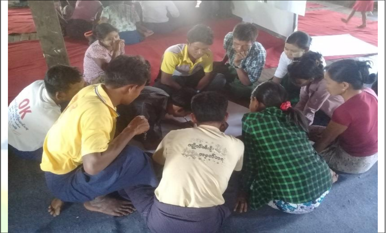
ကျေးရွာလုပ်ငန်းခွဲအတွက်အခက်အခဲများဖော်ထုတ်ဆွေးနွေးစဉ်