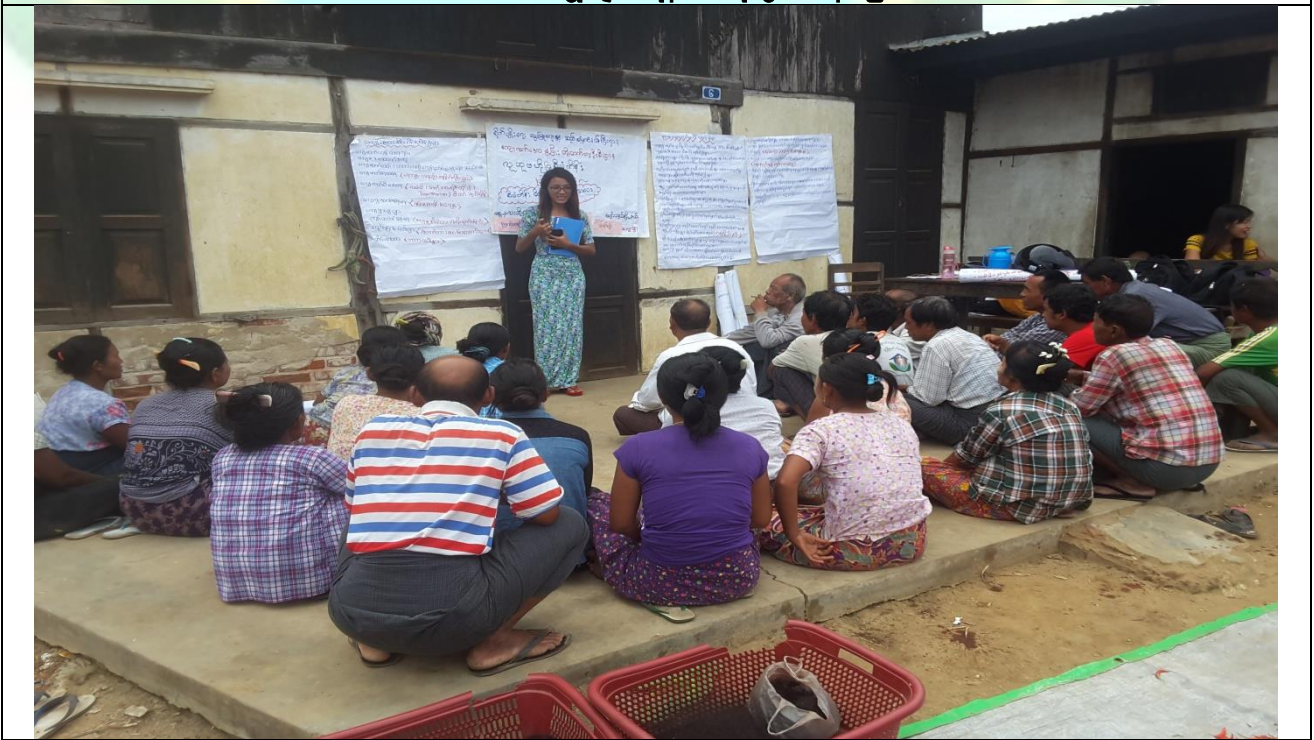
ပီမဲကိုန်းမိတ်ဆက်အစည်းအဝေးမှတ်တမ်းဓါတ်ပုံ