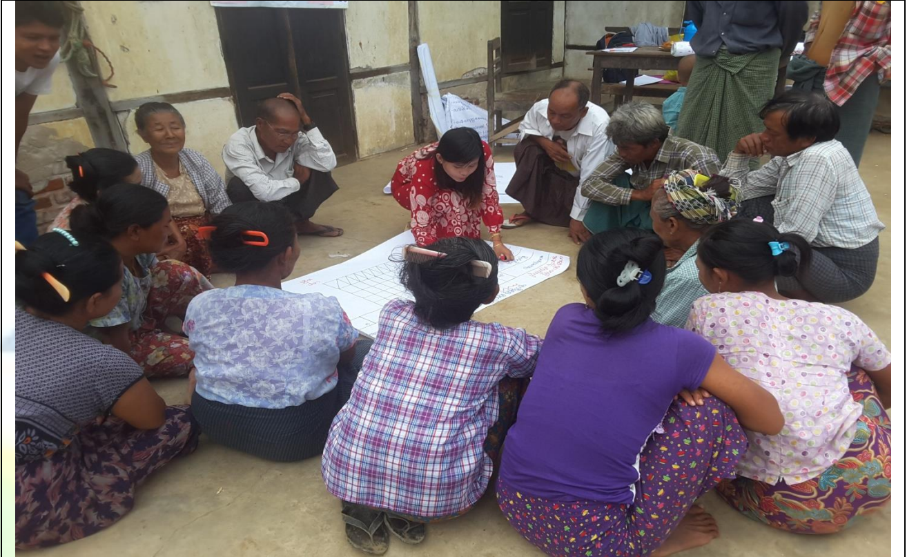
အမျိုးသမီးများပင့်ကူအိမ်ကွန်ယက်ရေးဆွဲနေစဉ်မှတ်တမ်းခါတ်ပုံ