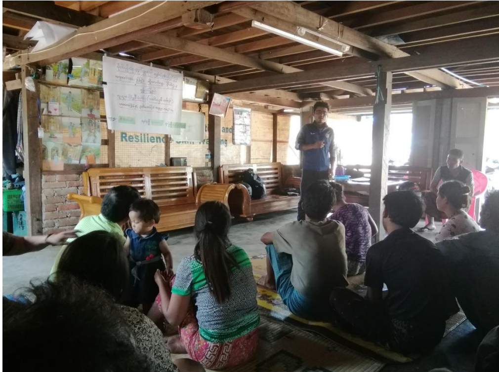
ပထမအကြိမ် ကျေးရွာစီမံကိန်းမိတ်ဆက်အစည်းအဝေး ဆောင်ရွက်ပုံ