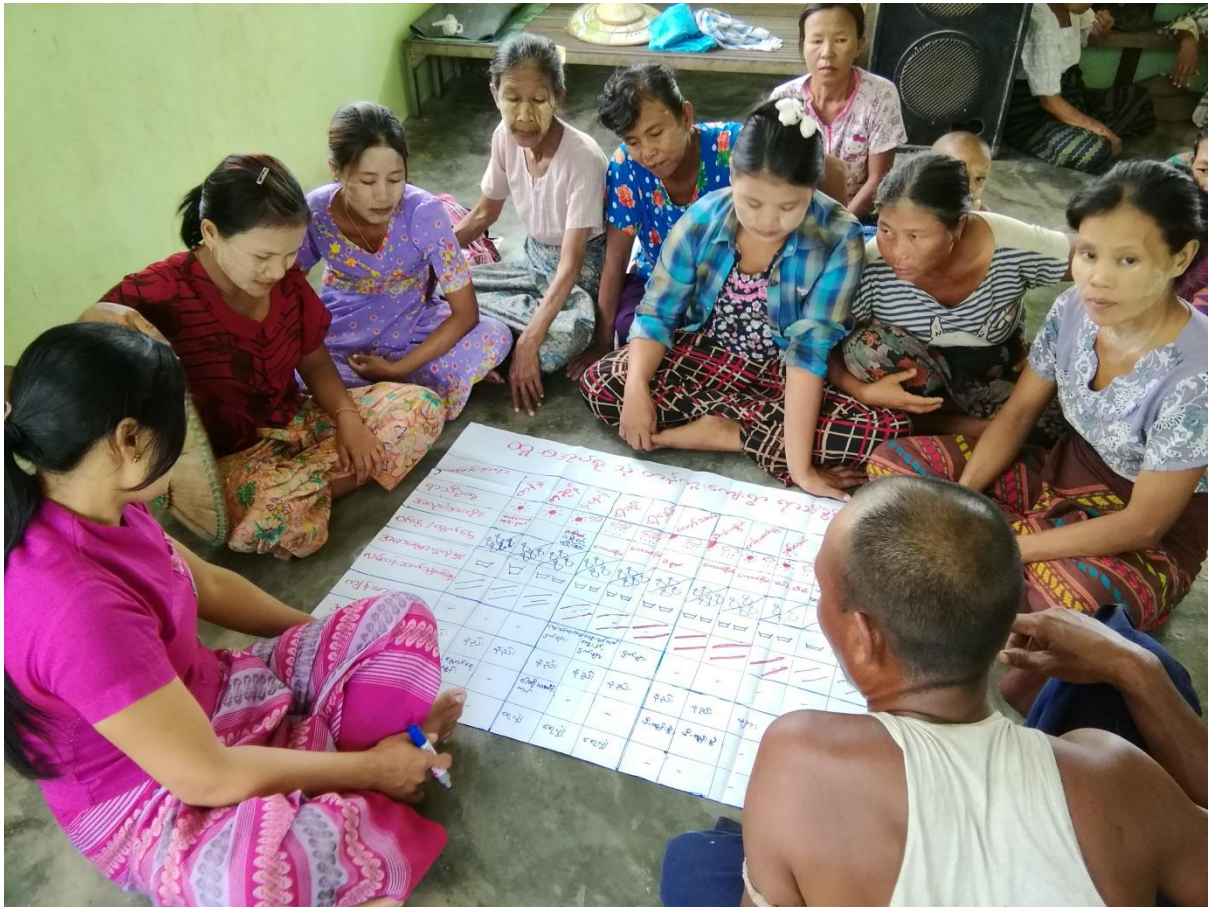
၇။ ကော်မတီများရွေးချယ်ခြင်းနှင့်ကျေးရွာဖွံ့ဖြိုးရေးအစီအစဉ်ဆောင်ရွက်မှု မှတ်တမ်းဓါတ်ပုံ