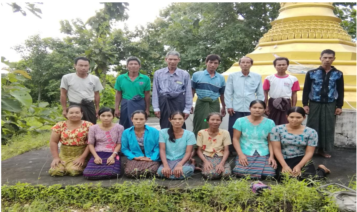
ထူးဝကျေးရွာအုပ်စု၊ သုံးတန်ကူးကျေးရွာ ၂၀၁၉-၂၀၂၀ ခုနှစ်

လူထုဗဟိုပြုစီမံကိန်း အင်ပူမြို့နယ် ၊ ဧရာဝတီတိုင်းဒေသကြီး ကျေးရွာဖွံ့ဖြိုးရေးအစီအစဉ်