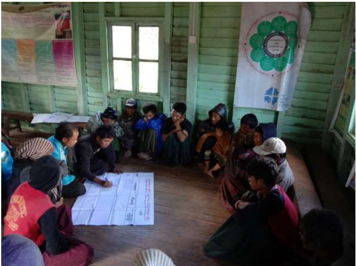
၈။ကျေးရွာအချက်အလက်(ပုံစံ-၁)