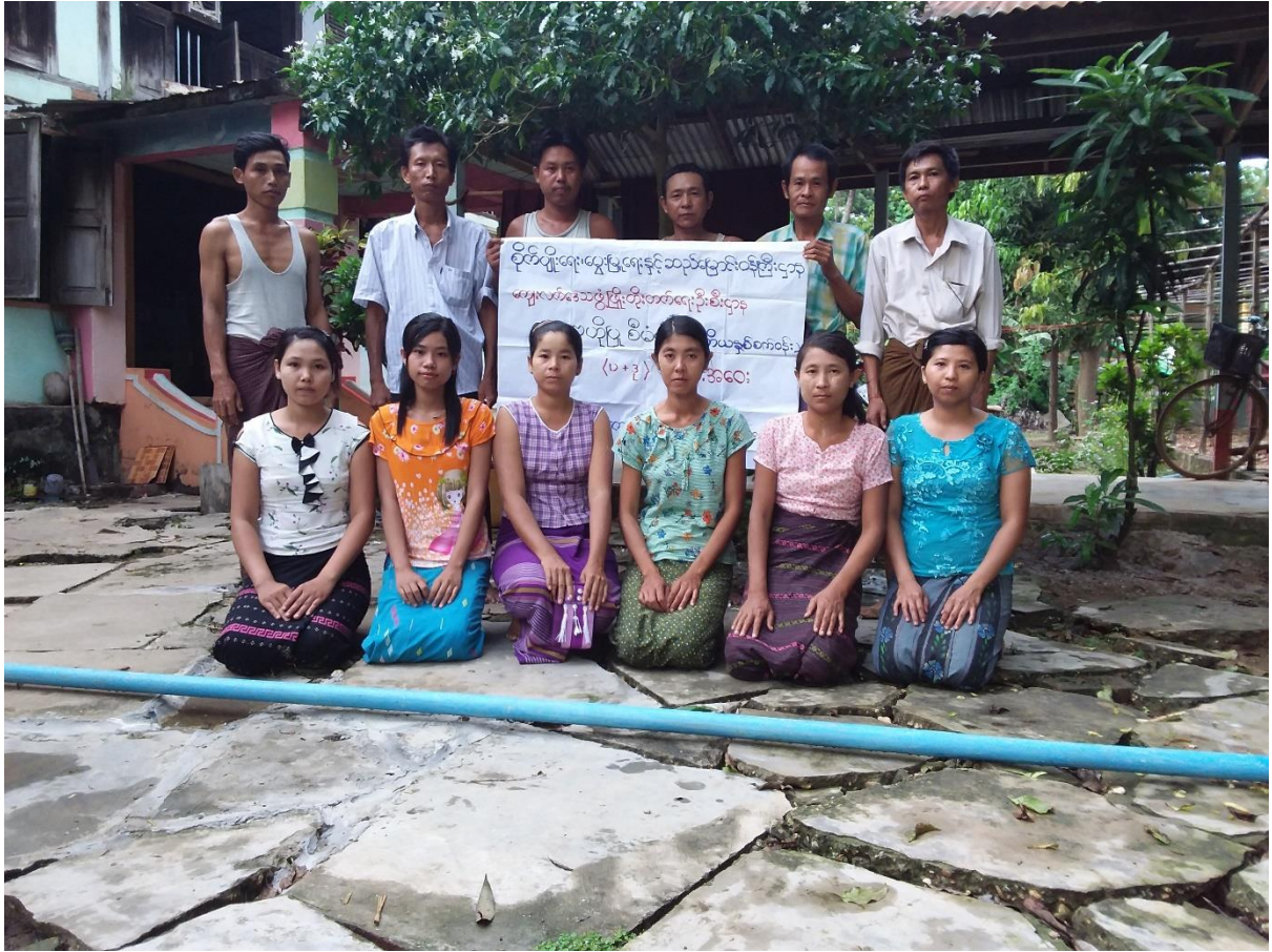
ကြို့ပင်သာကျေးရွာအုပ်စု၊ သစ်ကြိတ်ကုန်းကျေးရွာ ကျေးရွားစီမံခန့်ခွဲမှုအဖွဲ့