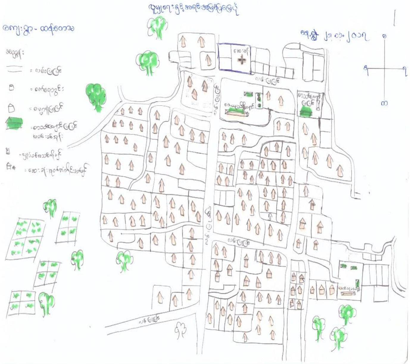
သင်းတရားကျေးရွာတည်နေရာမှာ- လတ္တီတွတ် ၂၁.၃၉လောင်တီတွတ် ၉၅.၅၈တွင် တည်ရှိပါသည်