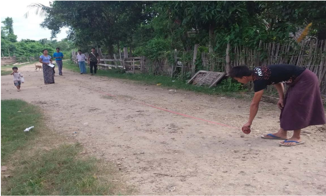
ကျေးရွာအုပ်စုကော်မတီဝင်များ၏ မှတ်တမ်းဓာတ်ပုံ