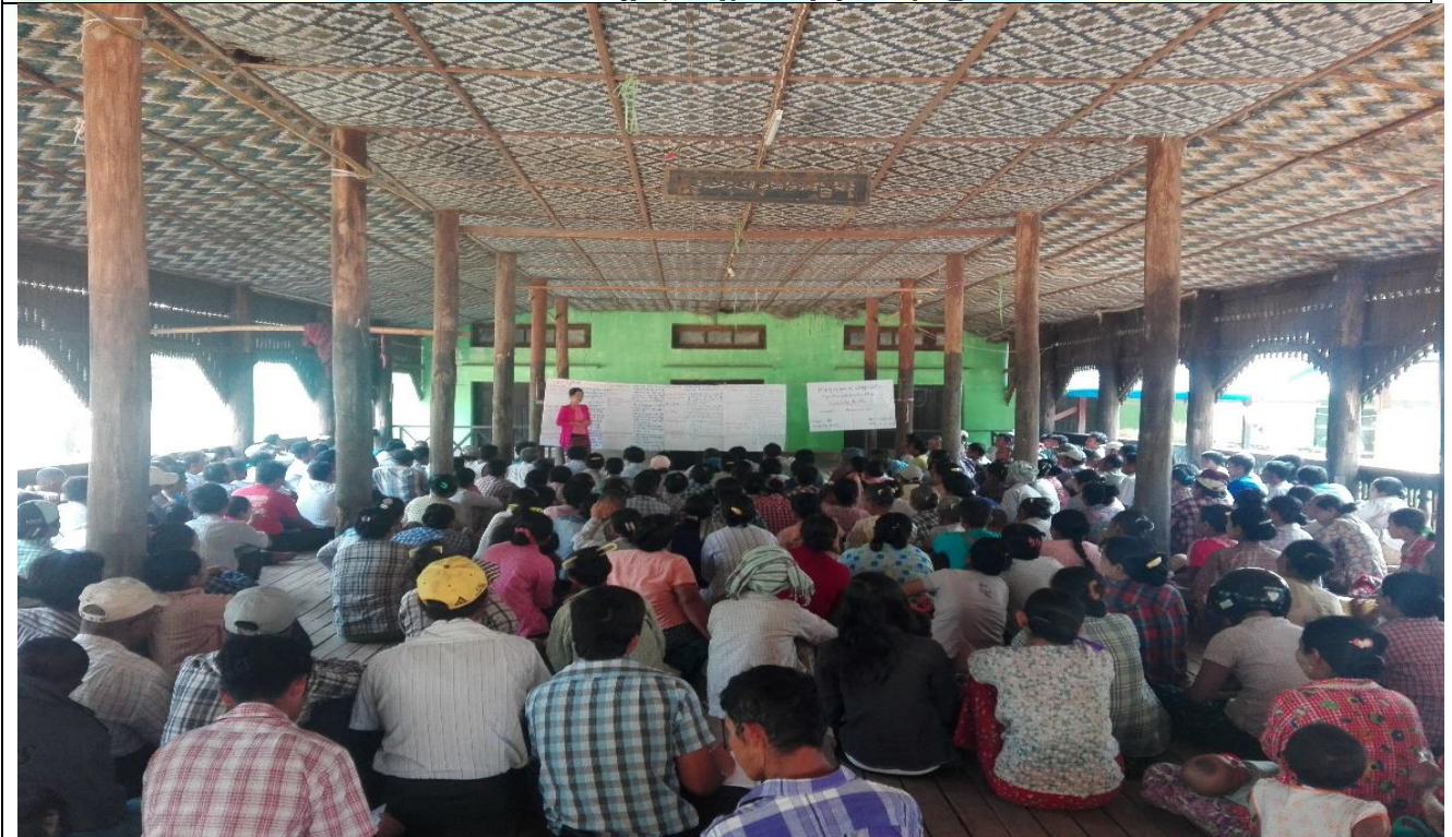
စီမံကိန်းမိတ်ဆက်အစည်းအဝေး မှတ်တမ်းဓါတ်ပုံ