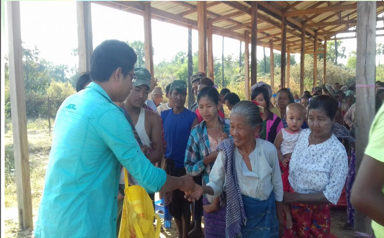
ကျေးရွာဖွံ့ဖြိုးရေးဦးစားပေးမဲပေးရန်တန်းစီနေကြစဉ်