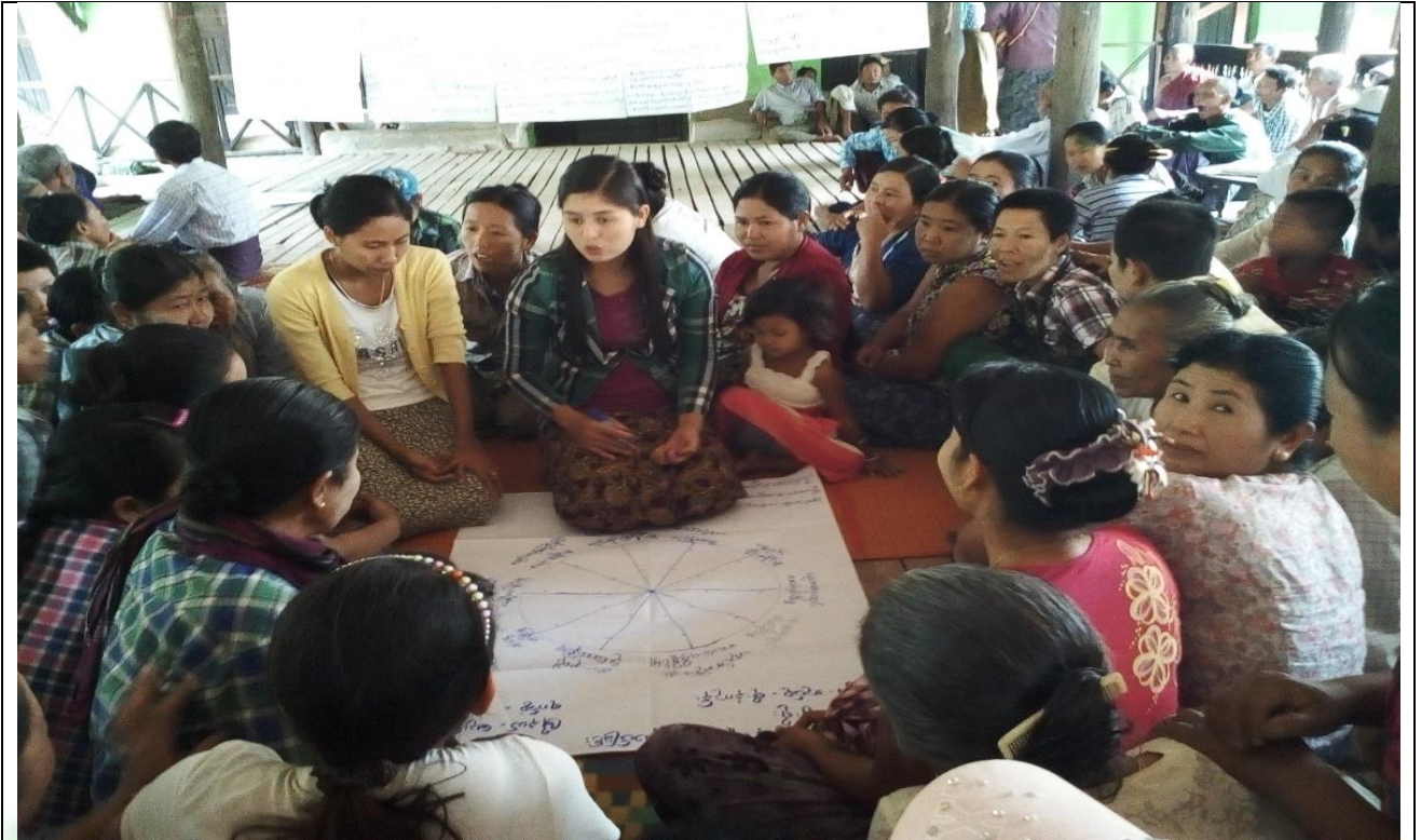
အမျိုးသမီးများပင့်ကူအိမ်ကွန်ယက်ရေးဆွဲနေစဉ် မှတ်တမ်းဓာတ်ပုံ