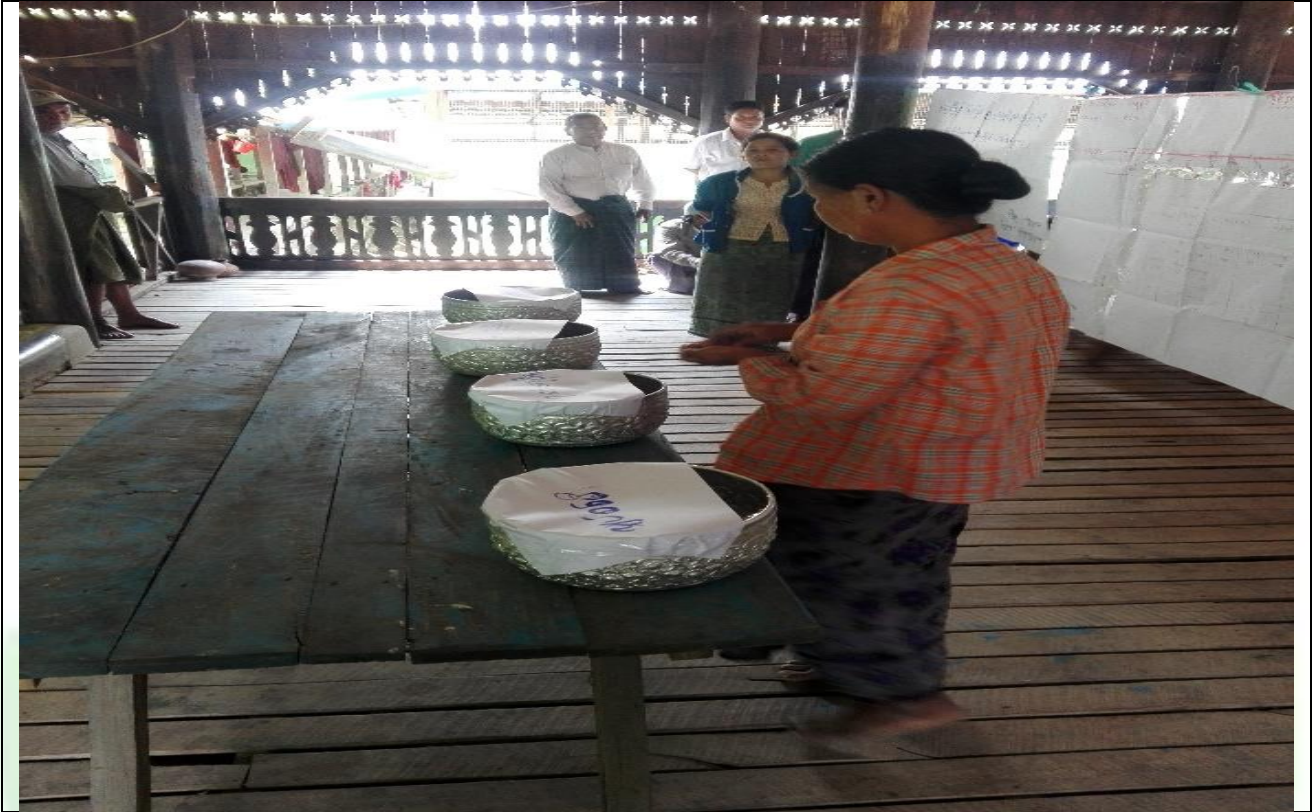
ကော်မတီရွေးချယ်ရန် မဲရေတွက်နေစဉ်