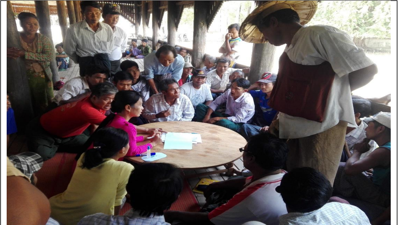
ကျေးရွာလုပ်ငန်းခွဲအတွက်အခက်အခဲများဖော်ထုတ်ဆွေးနွေးစဉ်