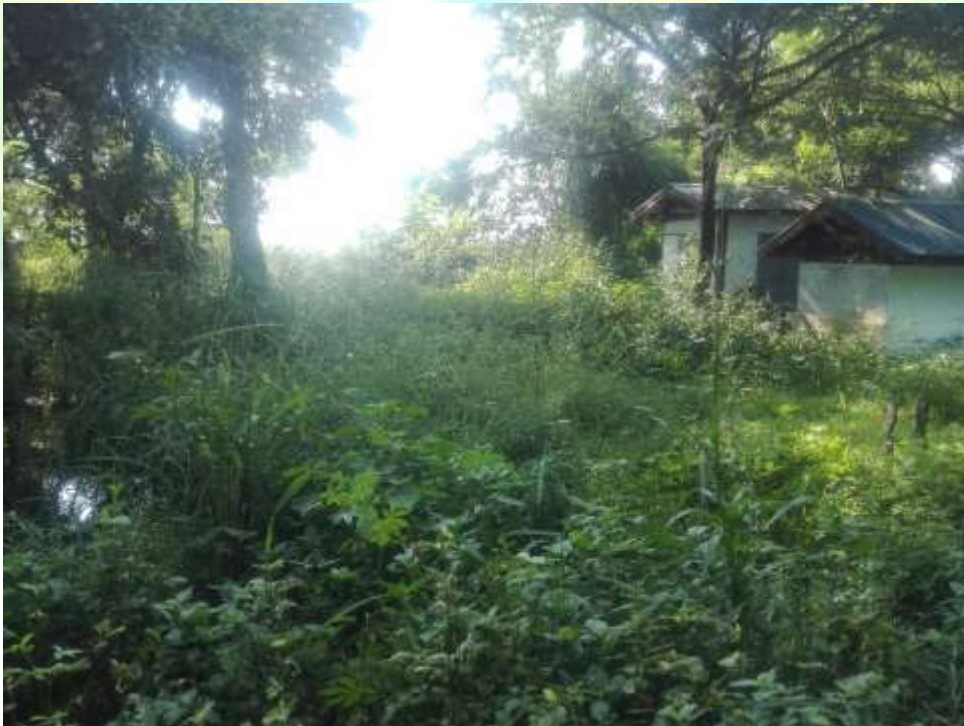
စီမံကိန်းလုပ်ငန်းခွဲ မစတင်မီ မှတ်တမ်းဓါတ်ပုံ