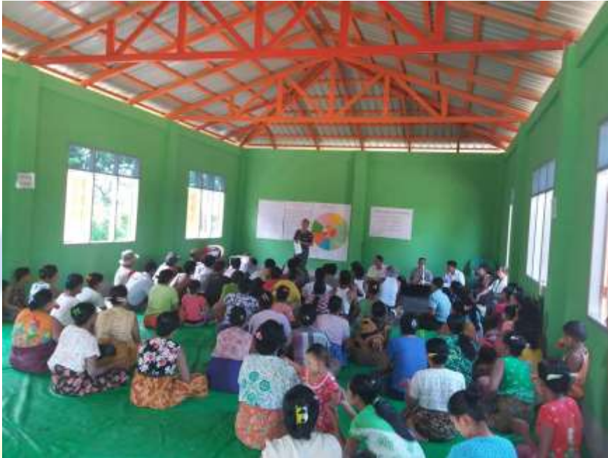
စီမံကိန်းမိတ်ဆက်အစည်းအဝေးမှတ်တမ်းတင်ဓါတ်ပုံ။

၈။ ကော်မတီဝင်များရွေးချယ်ခြင်းနှင့် ကျေးရွာဖွံ့ဖြိုးရေးအစီအစဉ်ဆောင်ရွက်မှု မှတ်တမ်း ဓါတ်ပုံများ