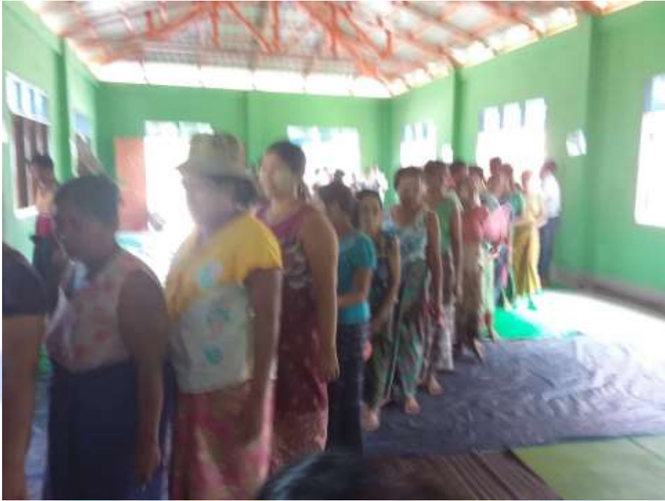
ဖွံ့ဖြိုးရေးစီမံချက်ရေးဆွဲသည့် အစည်းအဝေးမှတ်တမ်း ဓါတ်ပုံ