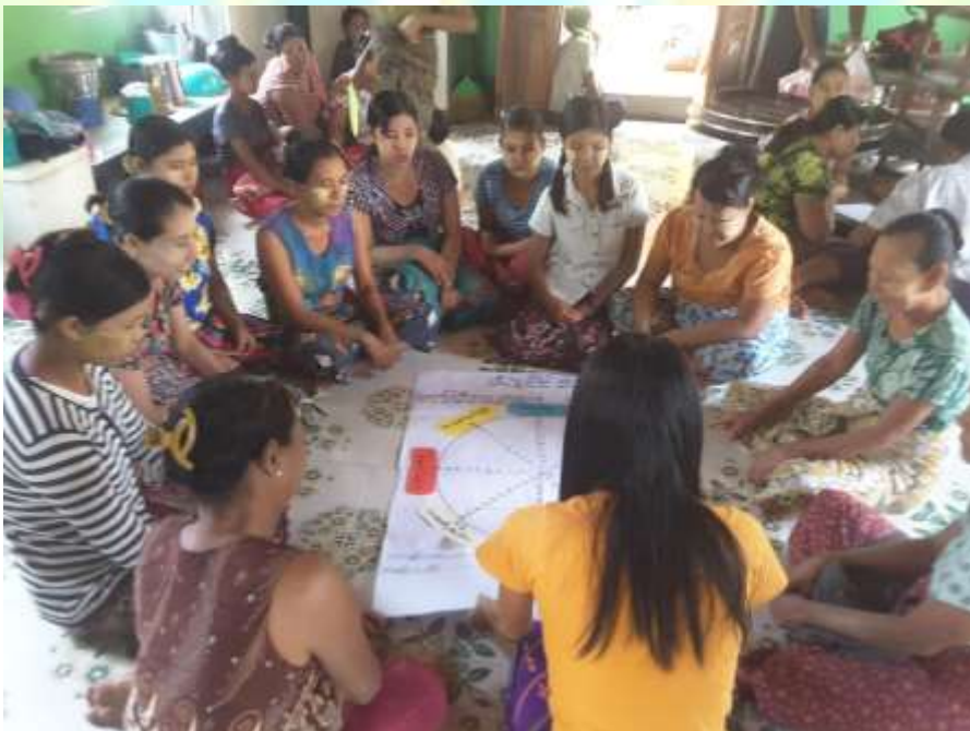
လူမှုဆန်းစစ်ခြင်း မှတ်တမ်းဓါတ်ပုံ