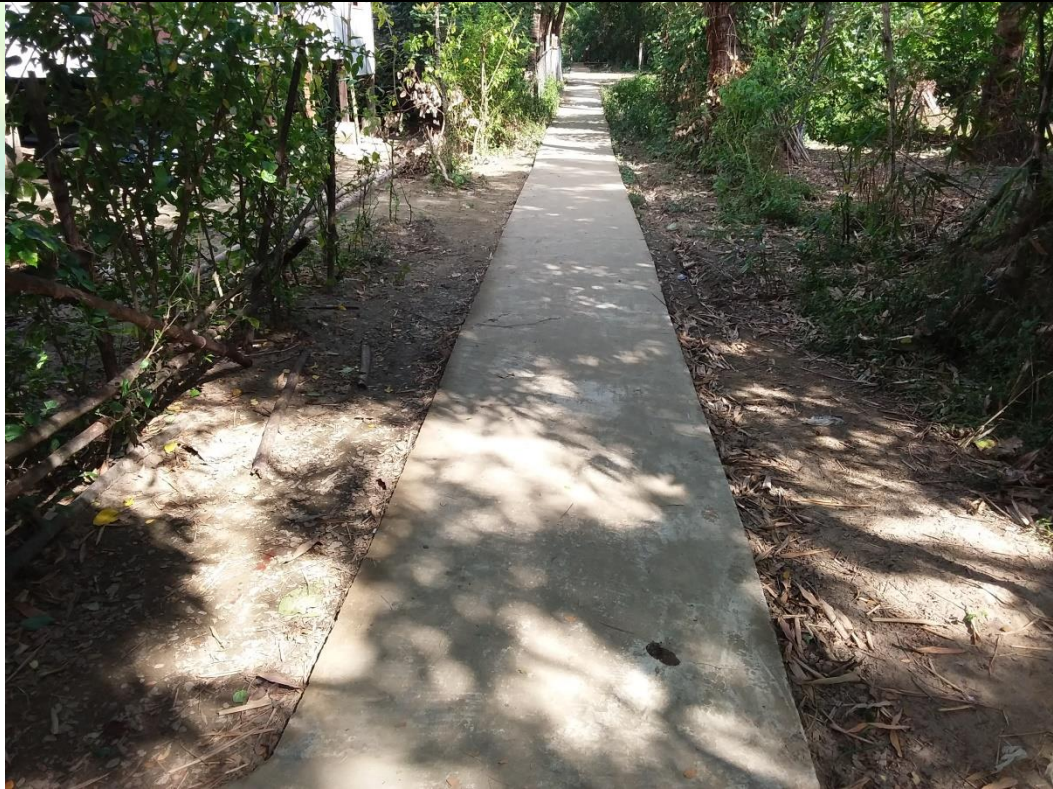
လုပ်ငန်းခွဲမစတင်မီ မှတ်တမ်းဓာတ်ပုံ