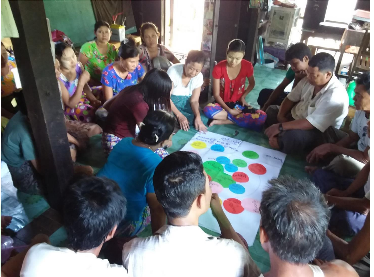
အမျိုးသား၊ အမျိုးသမီးအဖွဲ့များလူမှုဆန်းမှု မှတ်တမ်းတင်ခါတ်ပုံ။