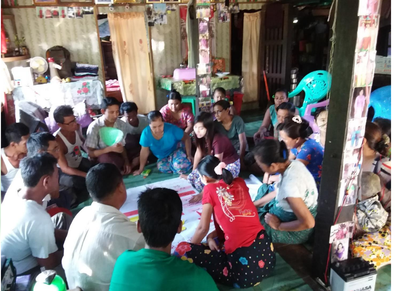
အမျိုးသား၊ အမျိုးသမီးများ မှတ်တမ်းခါတ်ပုံ