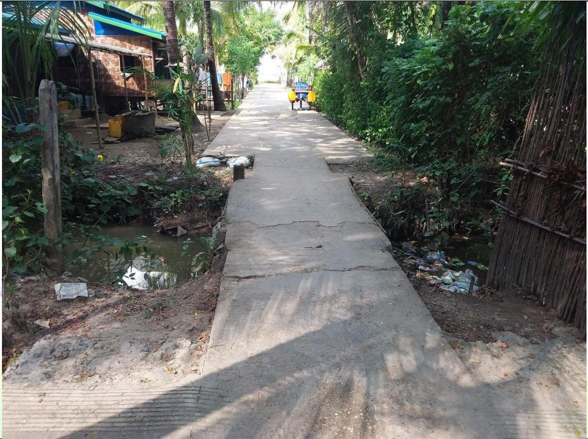
လုပ်ငန်းခွဲမစတင်မီ မှတ်တမ်းဓာတ်ပုံ