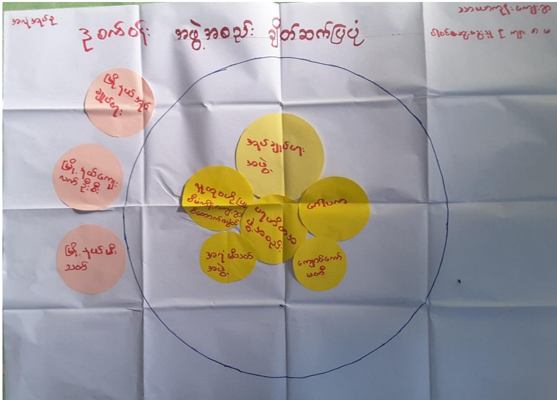
အဖွဲ့အစည်းချိတ်ဆက်ပြမြေပုံ

(ဃ) အဖွဲ့အစည်းချိတ်ဆက်ပြမြေပုံ နှင့် သုံးသပ်ခြင်း