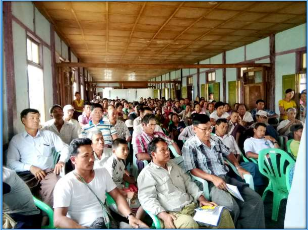
၇။ ကော်မတီဝင်များရွေးချယ်ခြင်းနှင့် ကျေးရွာဖွံ့ဖြိုးရေးအစီအစဉ်ဆောင်ရွက်မှု မှတ်တမ်းဓာတ်ပုံများ