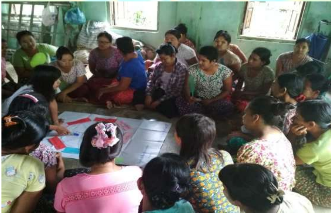
လူမှုဆန်းစစ်ခြင်းပြုလုပ်သည့် အစည်းအဝေးမှတ်တမ်း ဓါတ်ပုံ