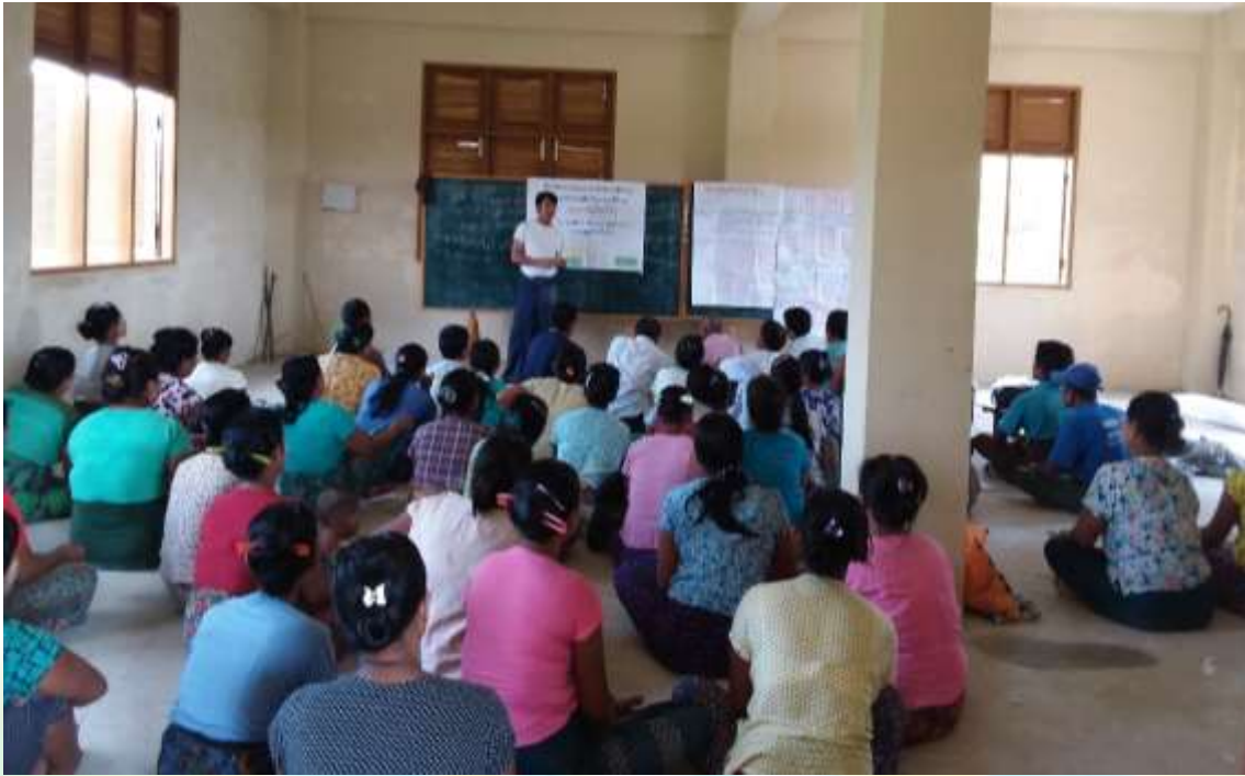
စီမံကိန်းမိတ်ဆက်အစည်းအဝေးမှတ်တမ်းတင်ဓါတ်ပုံ။

၈။ ကော်မတီဝင်များရွေးချယ်ခြင်းနှင့် ကျေးရွာဖွံ့ဖြိုးရေးအစီအစဉ်ဆောင်ရွက်မှု မှတ်တမ်းဓါတ်ပုံများ