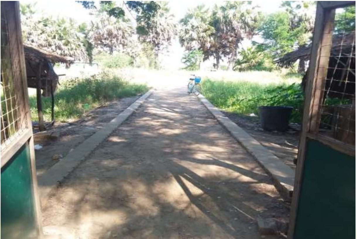
စီမံကိန်းလုပ်ငန်းခွဲ မစတင်မီ မှတ်တမ်းဓါတ်ပုံ