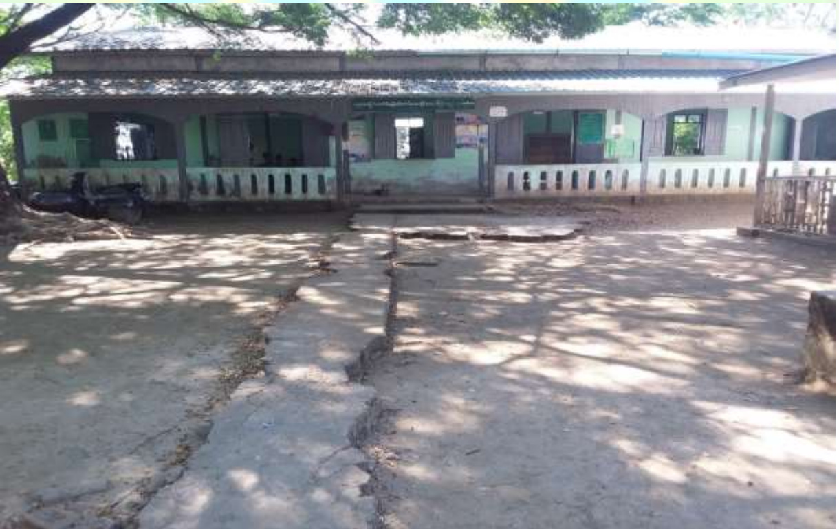
စီမံကိန်းလုပ်ငန်းခွဲ မစတင်မီ မှတ်တမ်းဓါတ်ပုံ