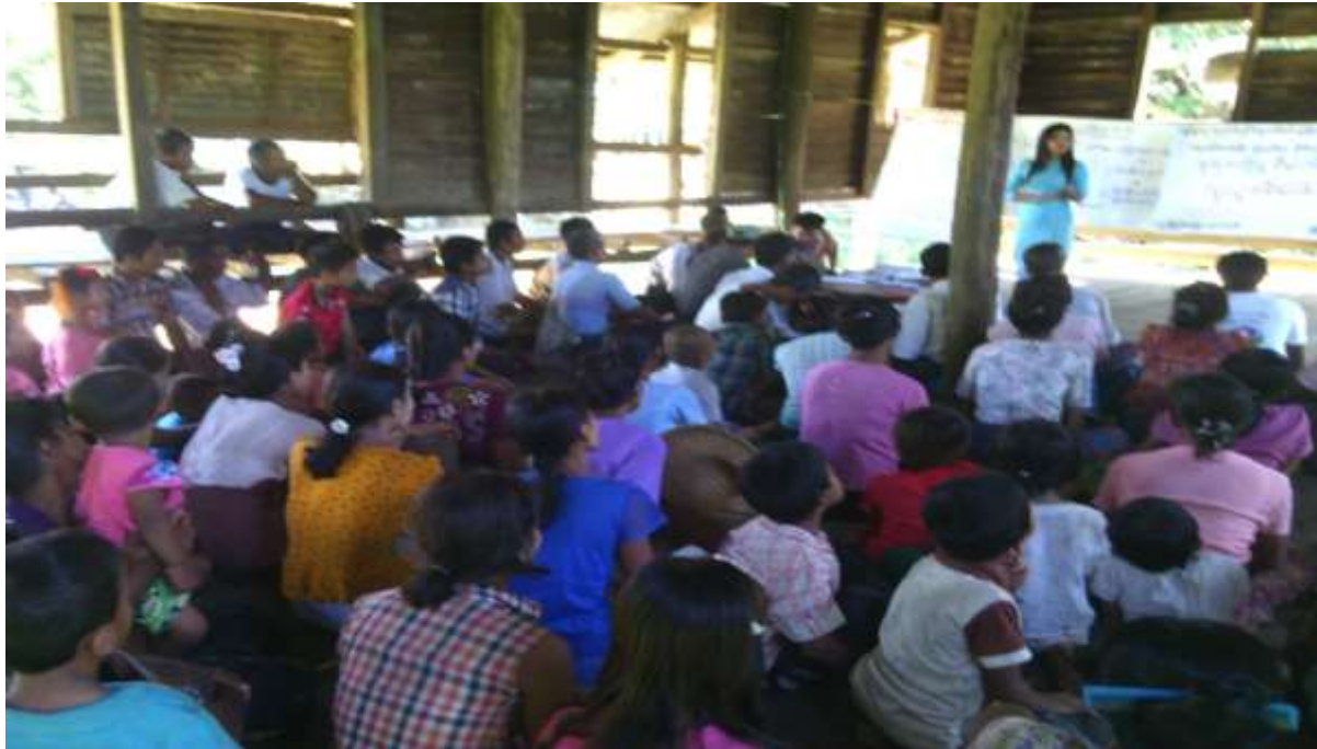
၁၈။ ကော်မတီဝင်များရွေးချယ်ခြင်းနှင့် ကျေးရွာဖွံ့ဖြိုးရေးအစီအစဉ်ဆောင်ရွက်မှုမှတ်တမ်းခါတ်ပုံများ