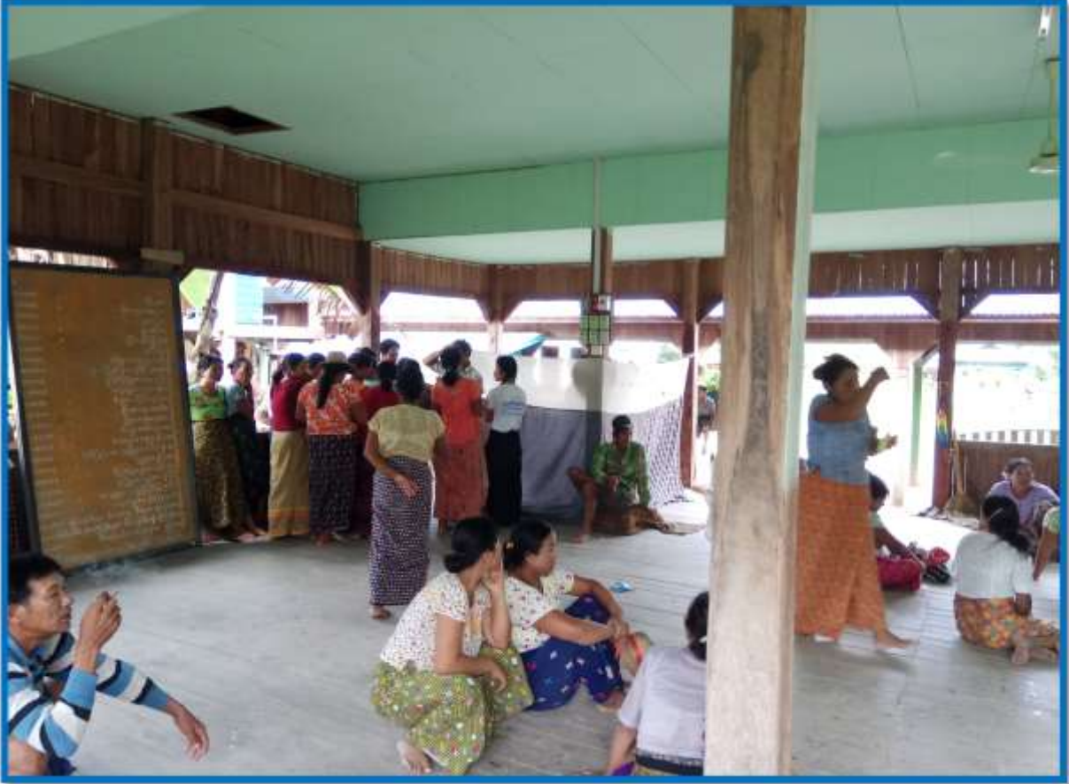
၇။ ကော်မတီဝင်များရွေးချယ်ခြင်းနှင့် ကျေးရွာဖွံ့ဖြိုးရေးအစီအစဉ်ဆောင်ရွက်မှု မှတ်တမ်းဓာတ်ပုံများ