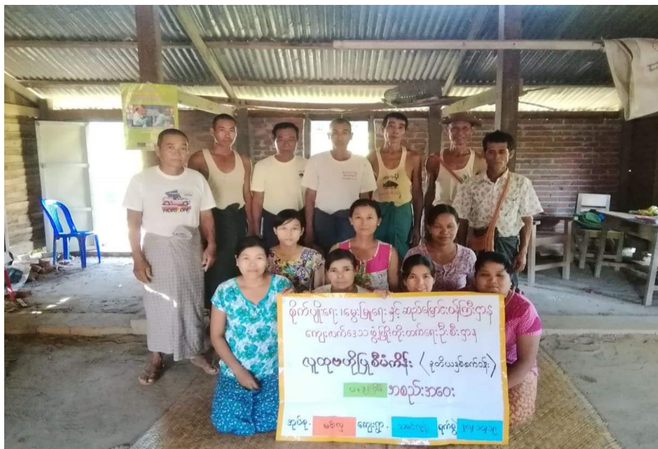
ကျေးရွာစီမံကိန်း အထောက်အကူပြုကော်မတီဝင်များ