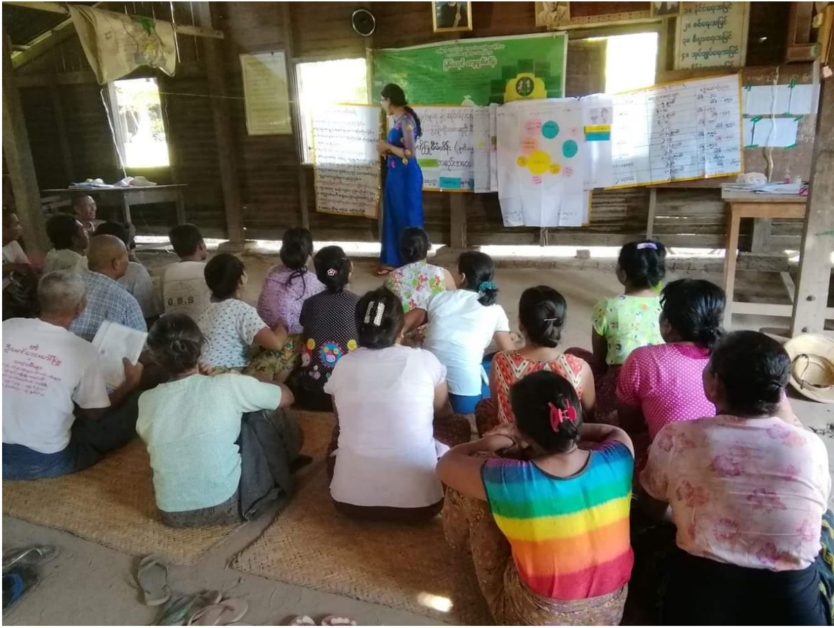
ပထမ+ဒုတိယ အကြိမ်ကျေးရွာလုံးကျွတ်အစည်းအဝေး