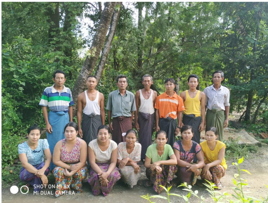
ကျိုကြီးကျေးရွာအုပ်စု၊ တဲကြီးစုကျေးရွာ