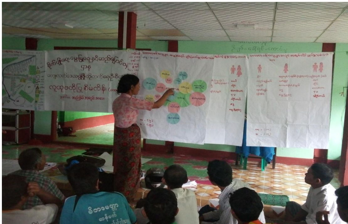
၈။ ကျေးရွာကော်မတီဝင်များစာရင်း